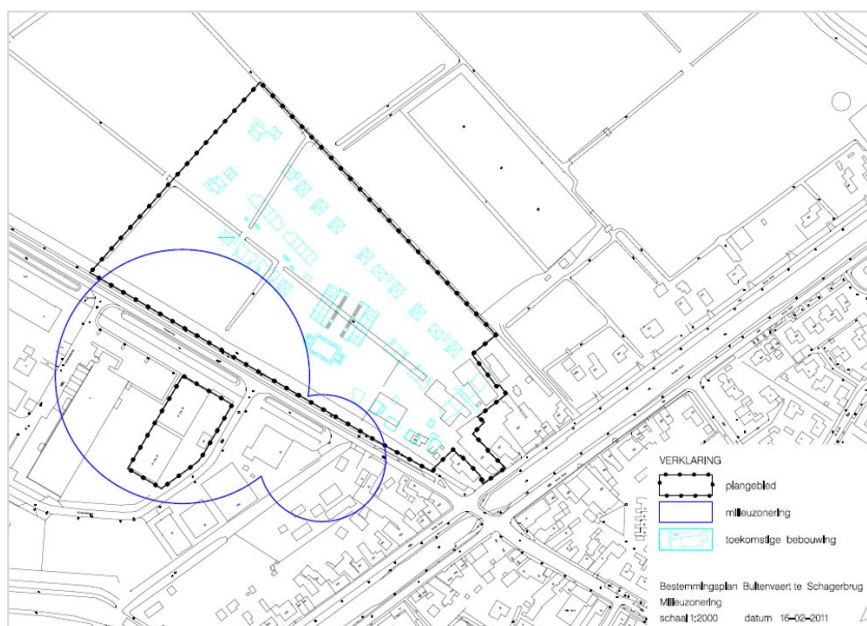
afb.7 Milieuozonering van 100 m en 50 m in relatie tot nieuwbouw (Bron: Indicatief matenplan van USP, verouderd verkavelingsbeeld)

IN het stedenbouwkundig plan Buitenvaert is rekening gehouden met deze hindercirkels door groene en parkruimte te situeren langs de Schagerweg. Binnen de zones wordt in het bestemmingsplan geen woningbouw mogelijk gemaakt. De uitvoering van het plan wordt niet belemmerd door milieuhinder vanwege bedrijven.