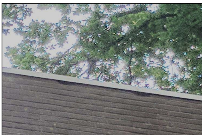
Gaten in de muur onder de dakrand.

Er zijn in het verleden in de omgeving van het plangebied een aantal soorten vleermuizen waargenomen. De meeste waarnemingen zijn van losse foeragerende of langsvliegende dieren. In het plangebied zijn geen waarnemingen bekend van vleermuizen met binding aan de bebouwing. Precieze locaties van verblijfplaatsen en andere belan-