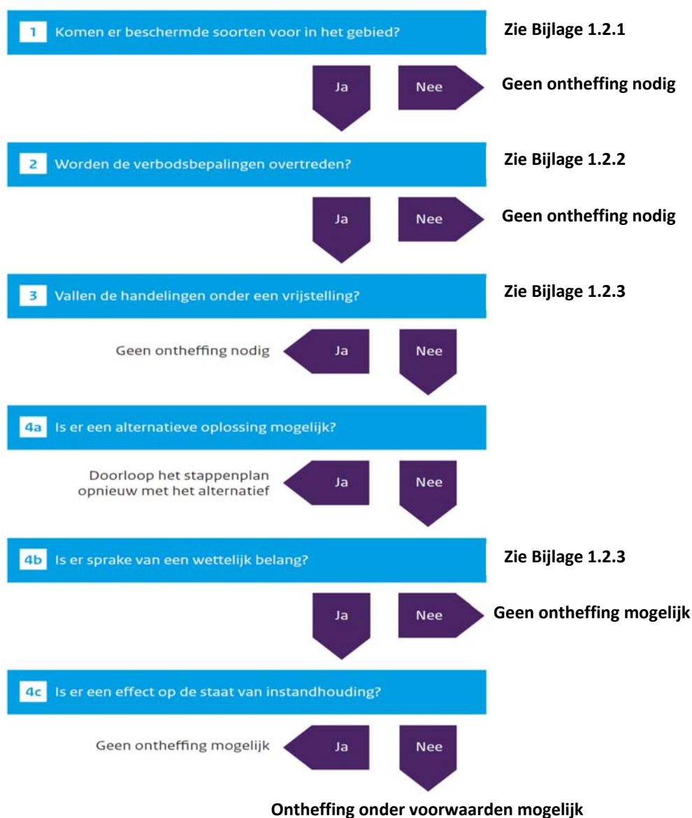
Figuur 2. Stappenplan procedure ecologisch onderzoek en ontheffing