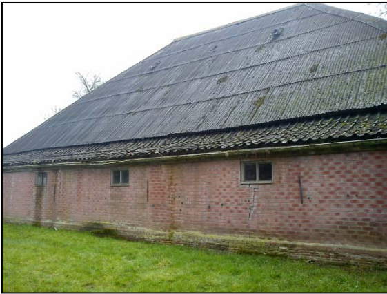
Foto-impressie van het plangebied