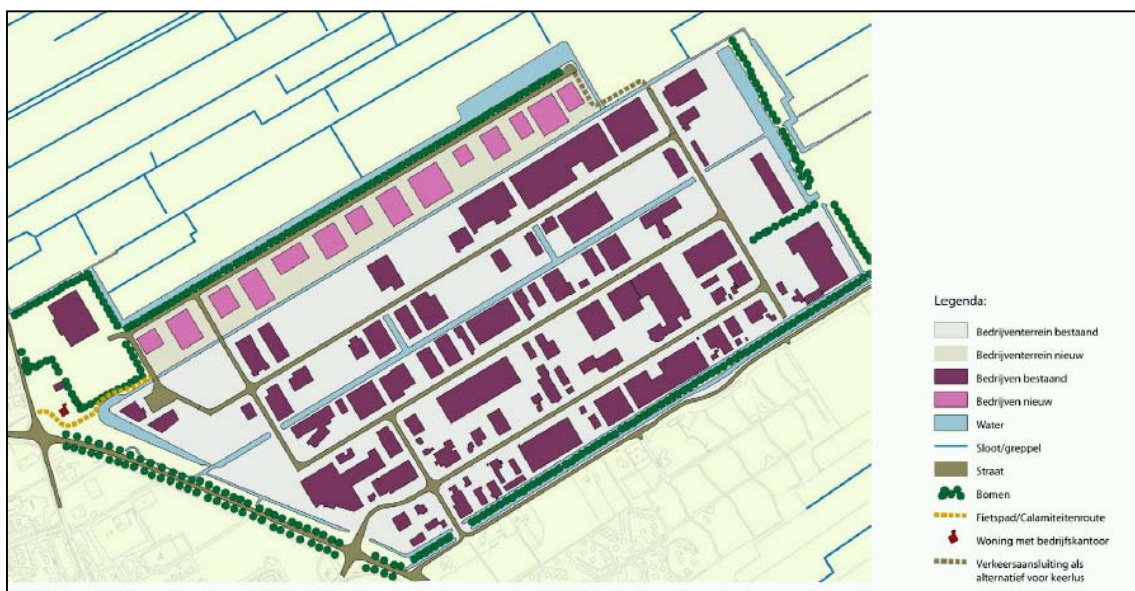
Stedenbouwkundige visie op de inrichting van het toekomstige bedrijventerrein, waarin de landschappelijke inpassing van het terrein aan de noord- en oostzijde is ingetekend.