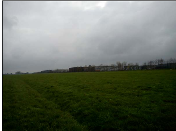
Foto-impressie van het terrein met van links naar rechts en van boven naar beneden: 1) de te slopen stolpboerderij waar verscheidene invlieg mogelijkheden voor vleermuizen aanwezig zijn, 2) idem, 3) het achtererf van de stolpboerderij, 4) uitzicht op de N241 en Veken III, 5) open grasweide waarop uitbreiding van de Veken III voorzien is en 6) achterzijde van het uitbreidings-terrein met uitzicht op meest oostelijke deel van het huidige Veken III.