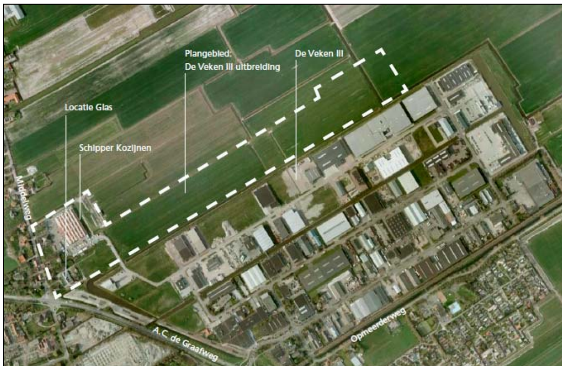
Overzicht van het plangebied voor de uitbreiding van het bedrijventerrein Veken III te Opmeer.