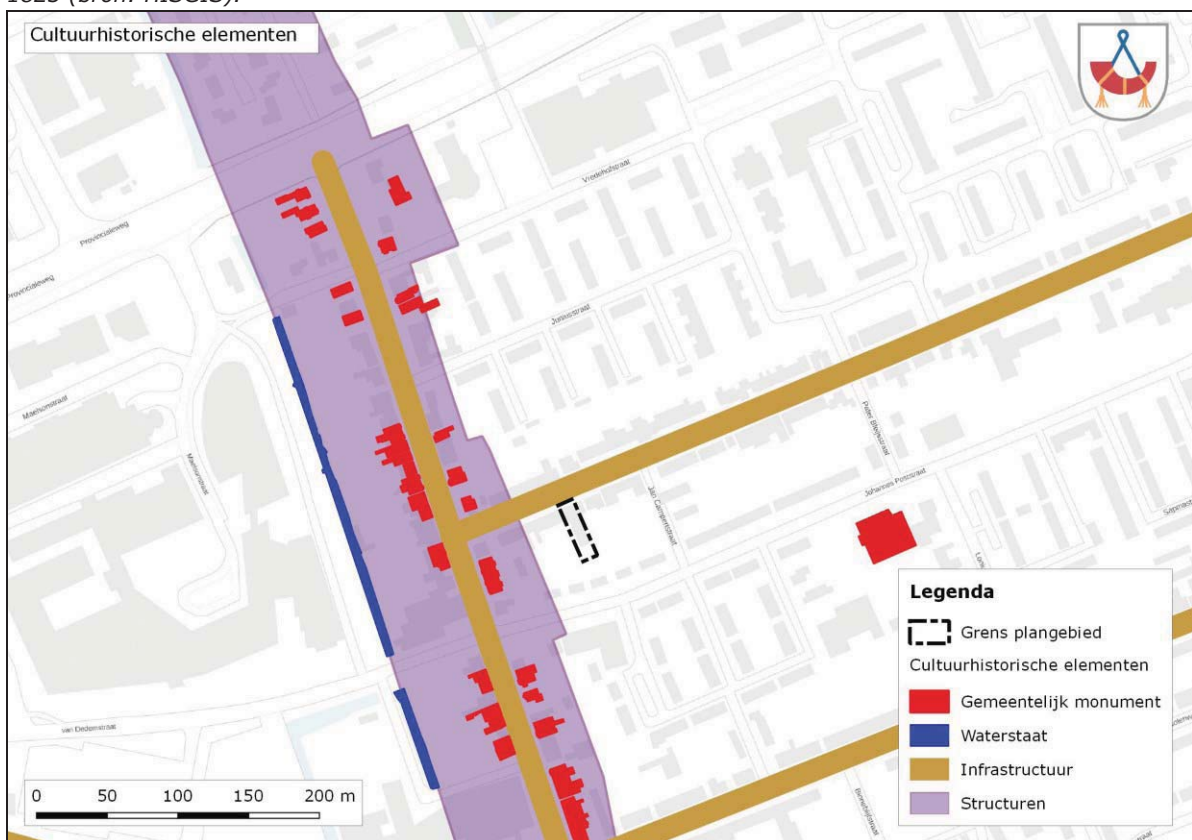
Afbeelding 3. Plangebied Tweeboomlaan 20 op de cultuurhistorische informatiekaart.