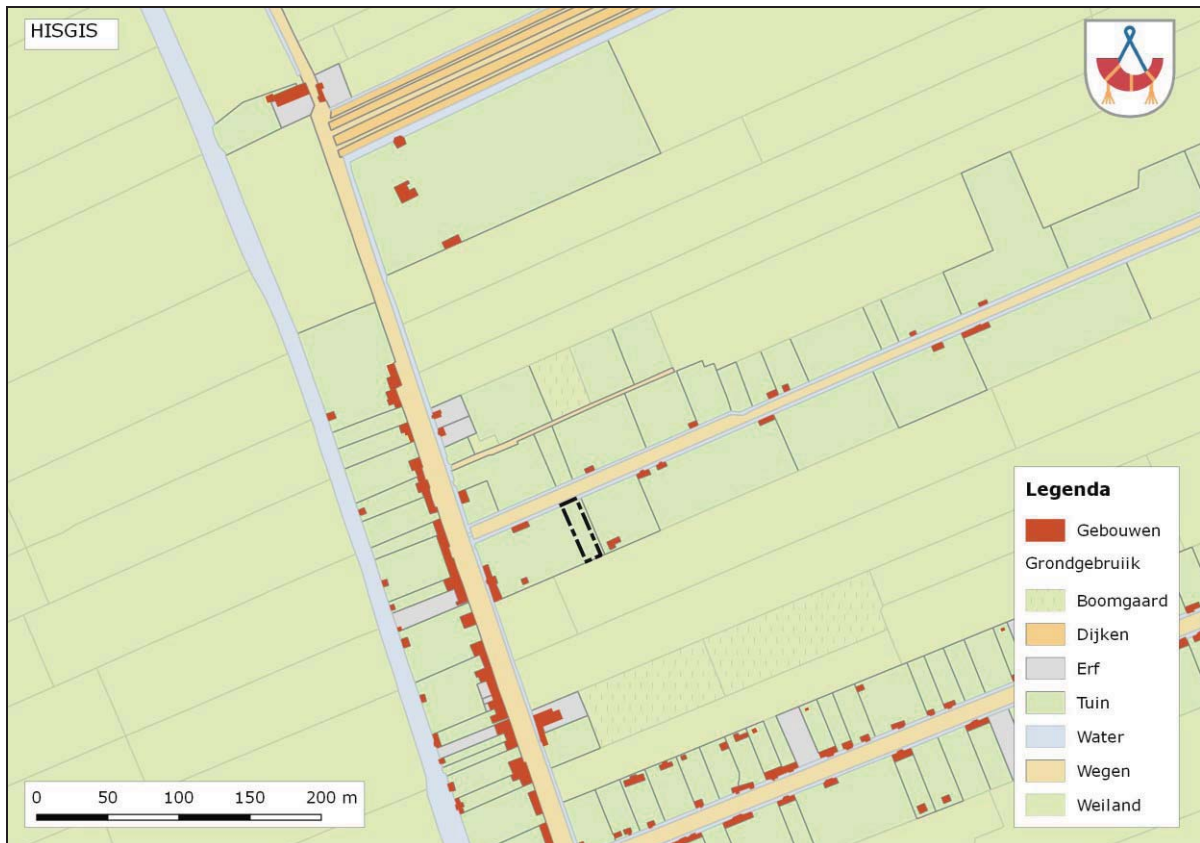
Afbeelding 2. Ligging plangebied Tweeboomlaan 20 op landgebruik van de kadastrale Minuut uit 1823.