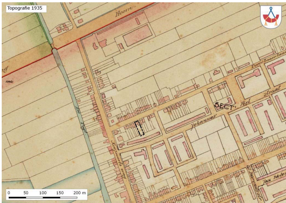
Afbeelding 4. Situatie rond 1935 met bebouwing

Op dit moment is de voortuin van de Tweeboomlaan 20 betegeld. Wijziging van de bestemming van bedrijf naar woning zou bijdragen aan herstel van de cultuurhistorische waarden op dit punt. Voorwaarde is dan wel dat het pand weer het aanzicht van een woning krijgt en dat de tegels uit de voortuin worden verwijderd en groen wordt terug gebracht. We staan dan positief tegenover het initiatief.