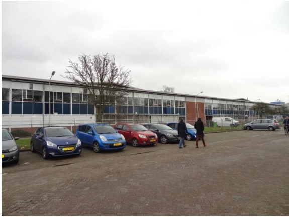
Figuur 12: Voorgevel van de eerste fase aan de Holenweg. Boven het platte dak van de voorbouw steken de flauwe zadeldaken uit van de twee oorspronkelijke productiehallen