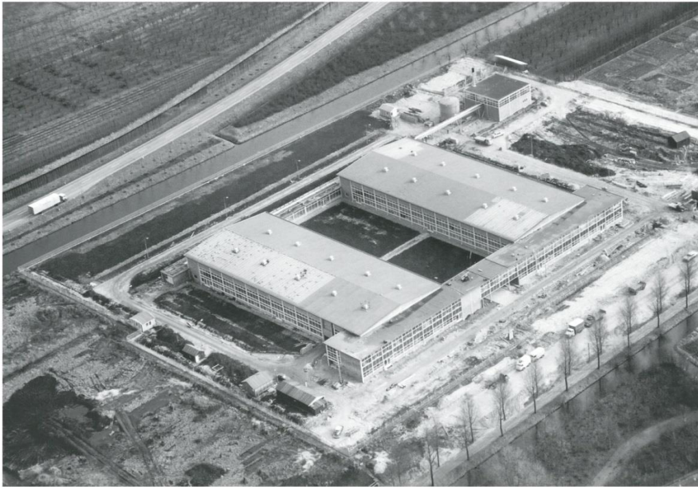
Figuur 8: Luchtfoto uit begin 1964 waarop de eerste fase bijna voltooid is. Achter de langgerekte voorbouw de twee productiehallen – links hal B, rechts hal A – die achteraan door een gang verbonden worden; rechtsboven het vrijstaande ketelhuis

In 1962-1964 wordt de eerste fase van het complex gerealiseerd bestaande uit twee evenwijdige productiehallen, een vrijstaand ketelhuis en een portiersloge. De twee door een binnenhof gescheiden hallen worden aan de voorzijde met elkaar verbonden door een langgerekte voorbouw van twee bouwlagen met plat dak en aan de achterzijde door een eenlaagse verbindingsgang.