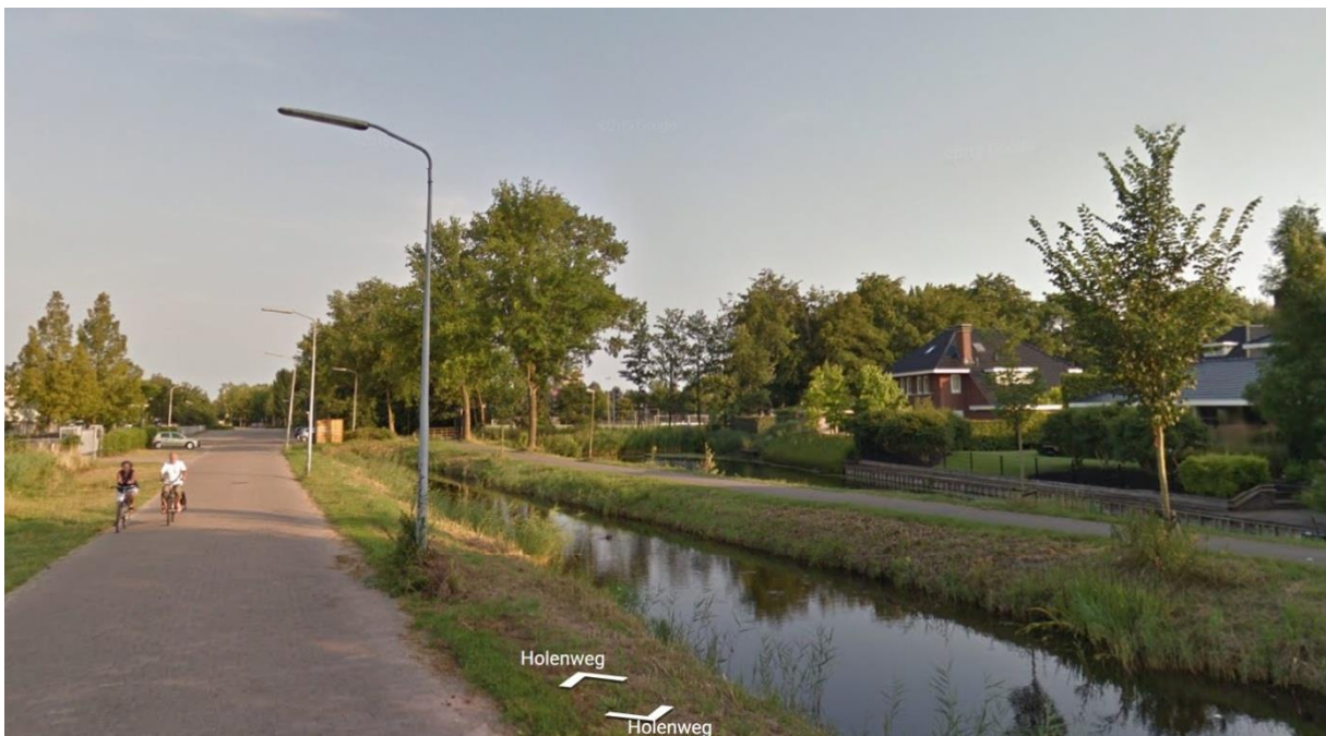
Figuur 3: Zicht op het zuiden richting het Philips-terrein. Aan rechterzijde is het oude tracé nog intact.