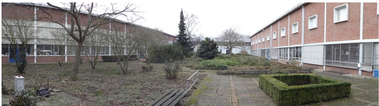
Figuur 12: Zuidelijke binnenhof met links de noordgevel van hal A, rechts de zuidgevel van hal B