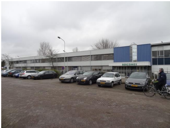
Figuur 13: Een van de jongere uitbreidingen ten noorden van de eerste fase van het Philipscomplex