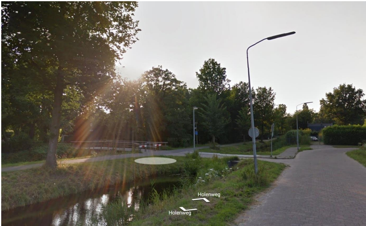
Figuur 2: Holenweg, ter hoogte van de sauna, in oorspronkelijke staat als dijklichaam met aan weerszijden een sloot.