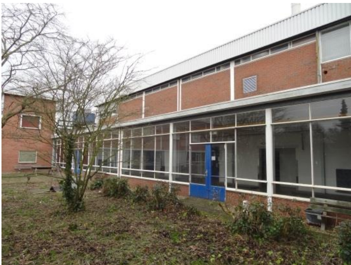
Figuur 11: Verbindingsgang tussen hal A en B; erachter de derde productiehal uit 1969-'70