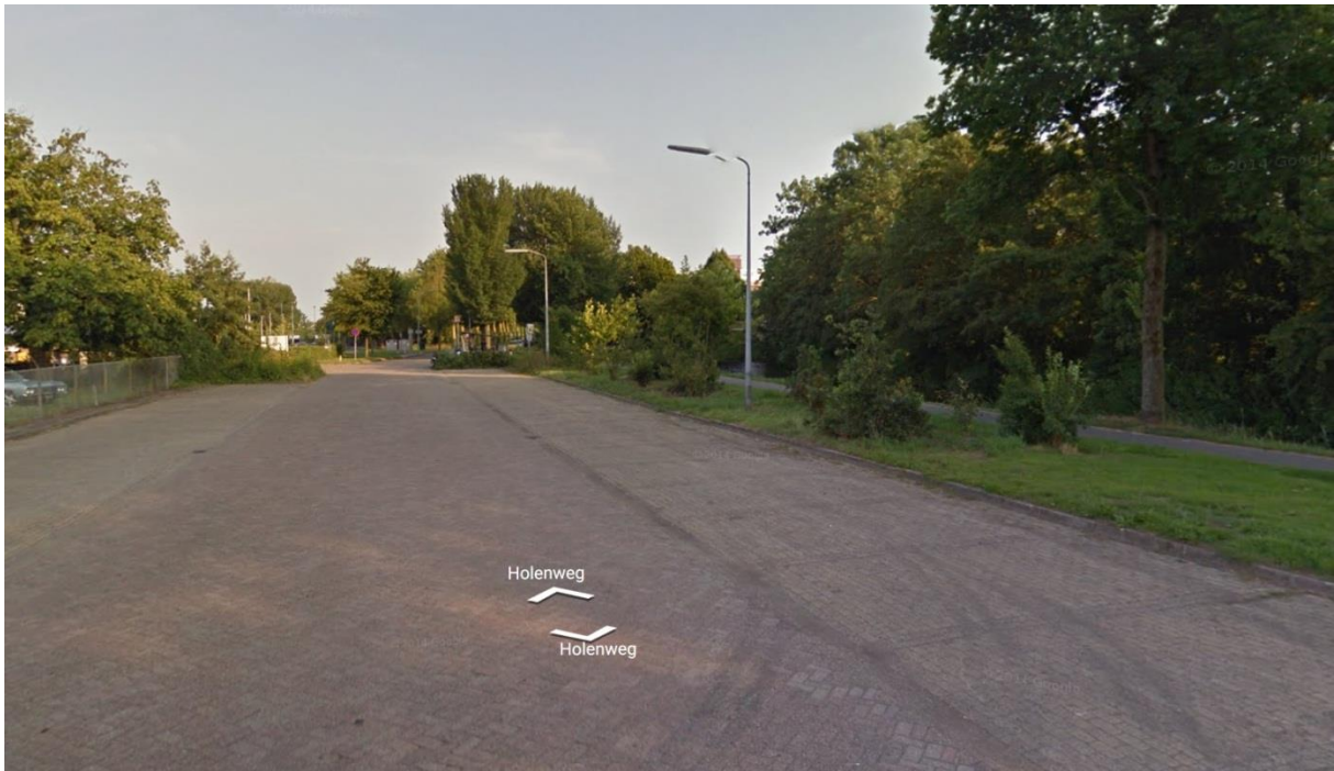
Figuur 4: De parkeerplaats bij het Philips-terrein, waar de sloot aan de oostzijde van de kade verdwenen is