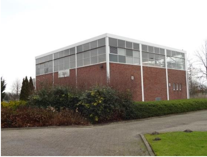
Figuur 10: Voormalig ketelhuis