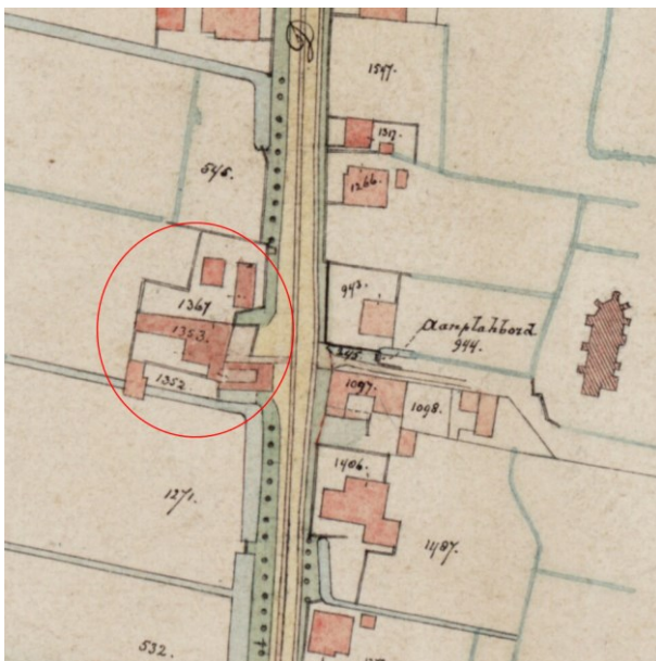
Afb. 6 Kadastrale kaart uit 1895

Vermoedelijk is de herberg daarna verbouwd, want de kadastrale nummers uit 1885 (A1306 en A1307) zijn op een kadastrale kaart uit 1895 veranderd in A1353 (afb. 6). Dat nummer bleef behouden tot in de jaren 20 (afb. 7), waaruit blijkt dat dit pand in die periode niet is gewijzigd.