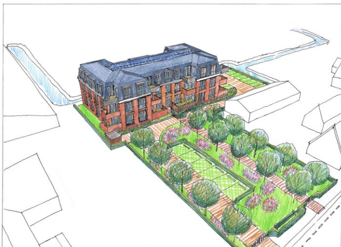
Afb. 2 Schetsontwerp van de nieuwbouw (bron: Bouwkundig Bureau Niels Gieling, 21-2-2014)

Op de Beleidskaart Archeologie Hoorn, versie 2013, staat de Dorpsstraat met een zone van bebouwing aangegeven als een gebied met archeologische waarde waarbij archeologisch vervolgonderzoek dient plaats te vinden bij bouwplannen groter dan 100 m 2 .