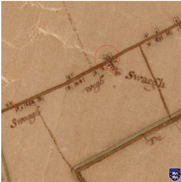
Afb. 3 Kaart van Dou, circa 1651-1654, met binnen de rode cirkel de onderzoekslocatie

onderzoeksterrein worden twee huizen aan het lint weergegeven (afb. 3). De locatie tegenover de kerk maakt aannemelijk dat hier reeds vanaf de 12 de eeuw bewoning is geweest.