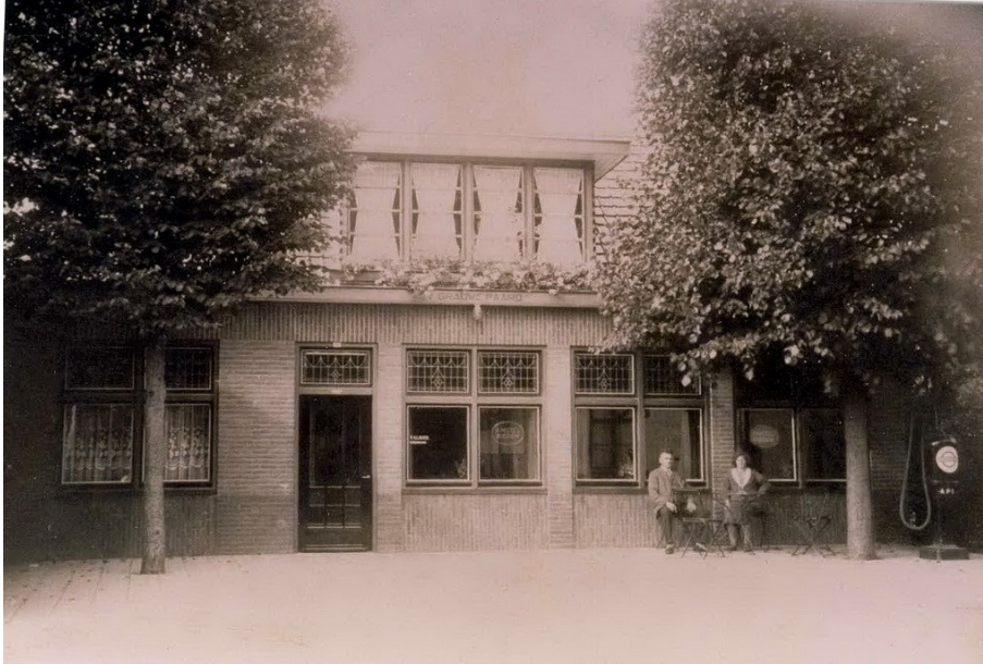
Afb. 10 Foto van café Het Grauwe Paard