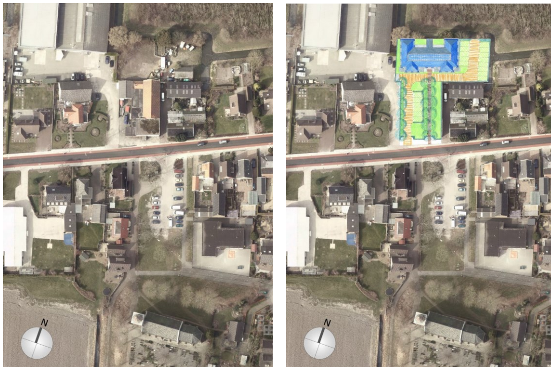
Afb. 1 Luchtfoto met links bestaande situatie en rechts het schetsplan.

Het volledige plangebied bestaat uit een aantal afzonderlijke kadastrale nummers: 3561 (61 m 2 , onbebouwd erf met garage/schuur), 3562 (510 m 2 , bebouwd horeca) en 6075 (1165 m 2 , onbebouwd erf met garage/schuur). De totale oppervlakte is 1736 m 2 .