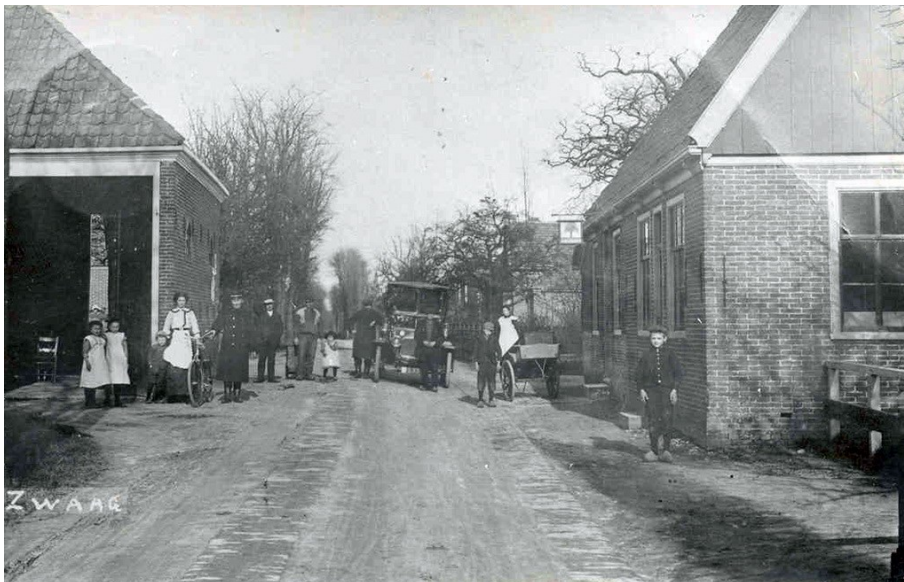
Afb. 8 Foto met links de doorrijstal van café Het Grauwe Paard, ca. 1910

In 1921 werd Het Grauwe Paard opnieuw te koop aangeboden. Het wordt omschreven als koffiehuis met kolfbaan en doorrijstal. In de herberg was nog altijd tevens een kruidenierswinkel gevestigd. De toenmalig eigenaar was A. Gorthuis. Waarschijnlijk was de koper P. Karsten want hij kreeg in 1928 vergunning tot het verplaatsen van een raam- en deurkozijn (WFA, toeg.nr. 0689, inv.nr. 1116).