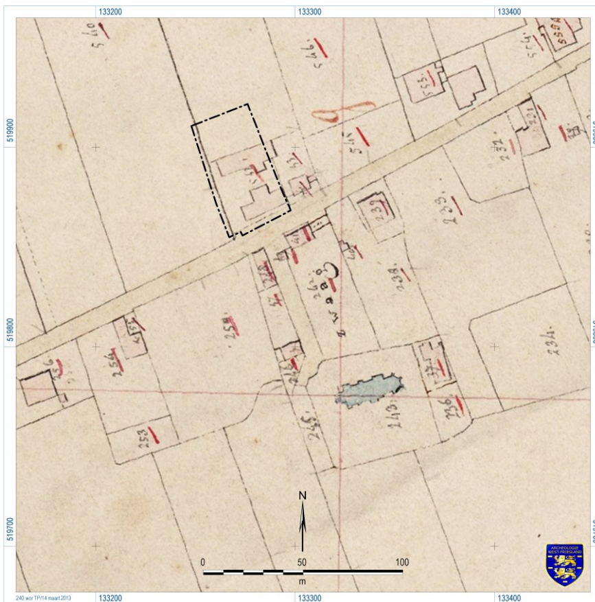
Afb. 4 Kadastrale kaart van 1823

Zeker is dus dat al in het begin van de 19 de eeuw een herberg op het perceel stond. De naam Het Grauwe Paard bestond in ieder geval al in 1808, zoals blijkt uit een krantenbericht (Oprechte Haarlemse Courant 6-12-1808: Herberg het Grauwe Paard). Vermoedelijk dateert deze naam van oorsprong uit de 17 de of 18 de eeuw, hoewel dit vooralsnog niet aantoonbaar is.