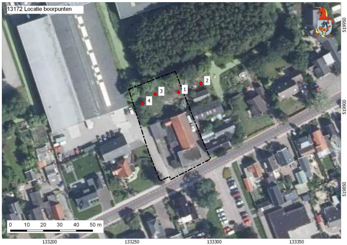
Afbeelding 3. Locatieboorpunten op luchtfoto.