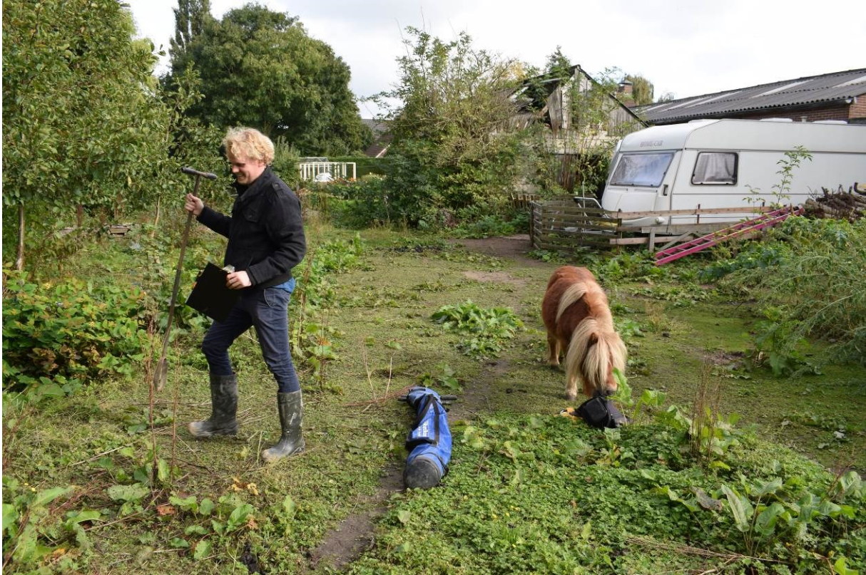
Afbeelding 2. Huidige situatie gefotografeerd vanuit het westen.