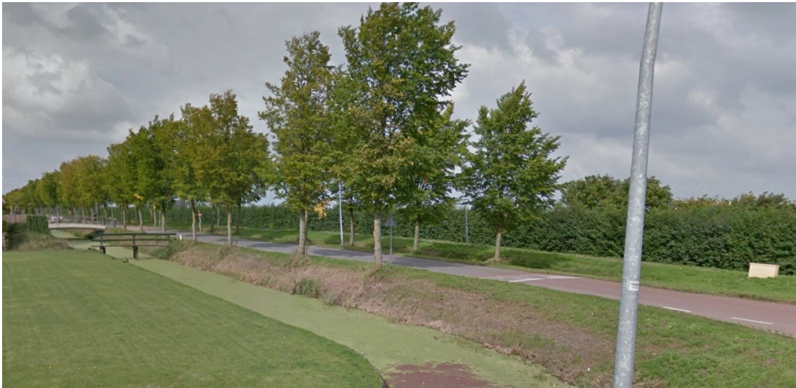
Figuur 1: De Rijweg gelegen aan de oostzijde van het plangebied dat oorspronkelijk de grens vormde van het ontginningsgebied