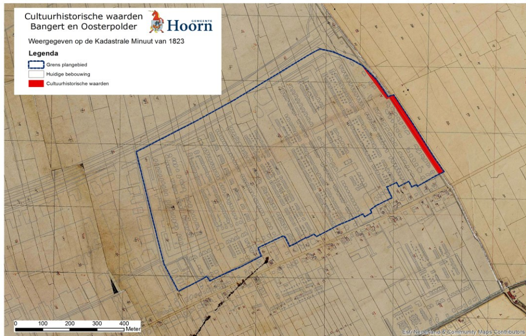
Figuur 2 in rood aangegeven de te beschermen cultuurhistorische waarden. De CHW moet omvatten de verhoogde Rijweg en de sloot en oevers.

Water is in de Bangert & Oosterpolder nadrukkelijk aanwezig. Voor het nieuwbouwplan is een waterstructuur bedacht met in de noordoostzijde meanderende singels (Waterland) en in het zuidwesten vijvers (Hoge Hemen). De vijvers zijn, verwijzend naar de oorspronkelijke kavelstructuur, rechthoekig en hebben zoveel mogelijk aansluiting gekregen op de linten. De noord-zuid gerichte verkavelingsstructuur is grotendeels overgenomen in het