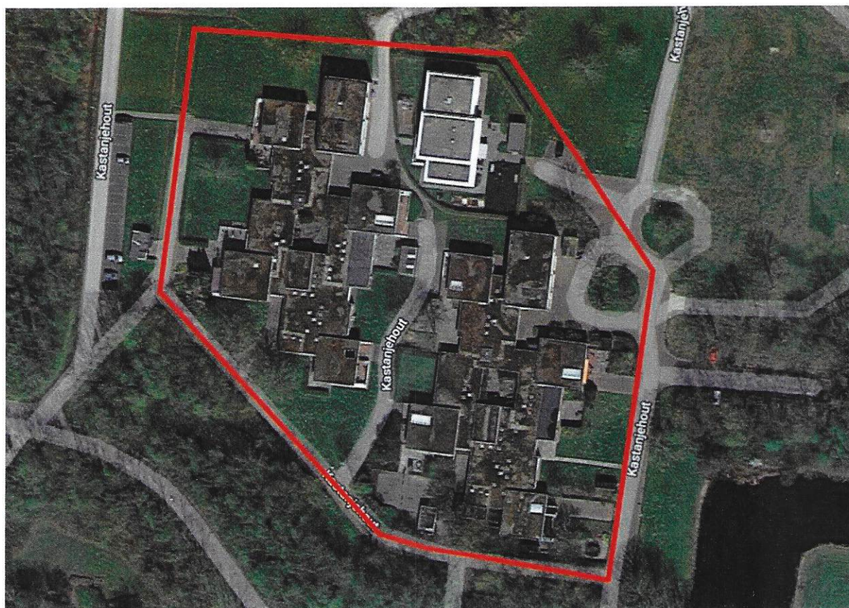
Figuur 1: Het plangebied.