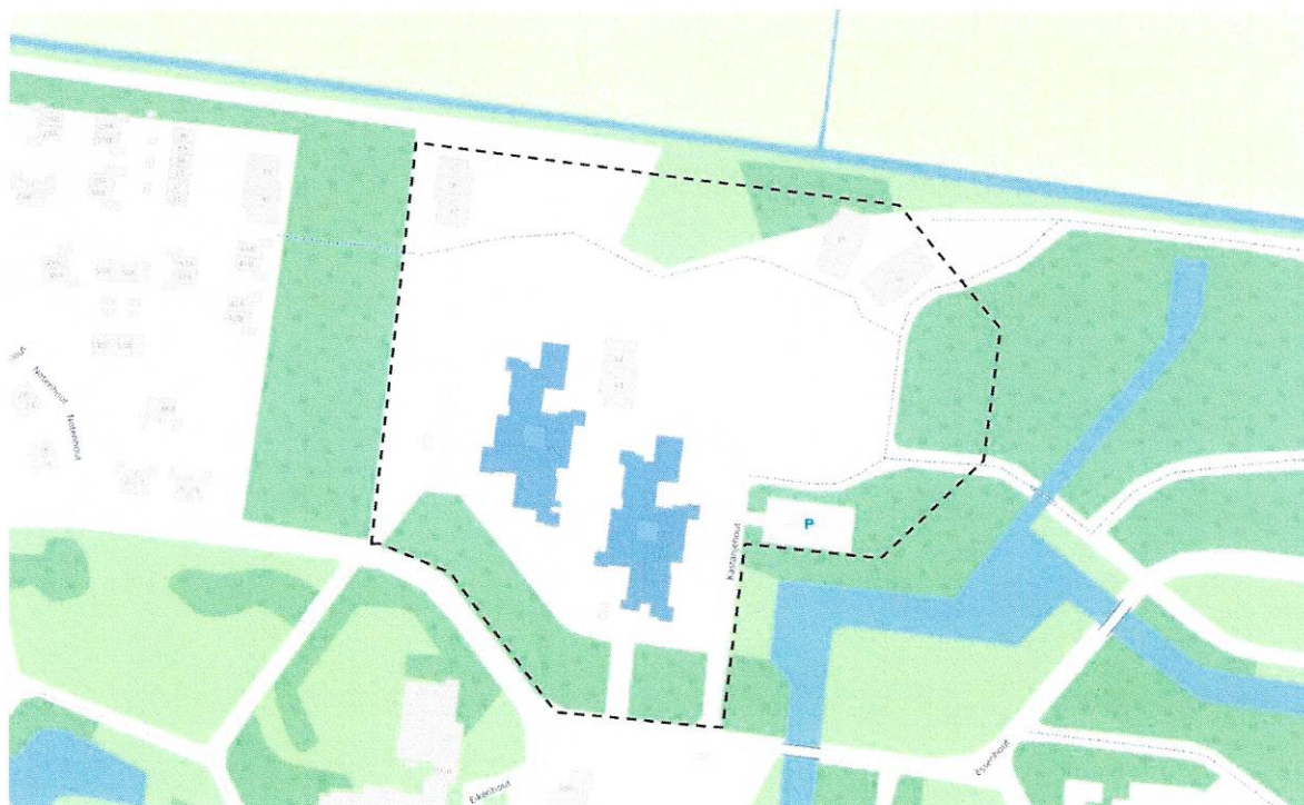
Figuur 2: Te saneren panden (blauw gemarkeerd).