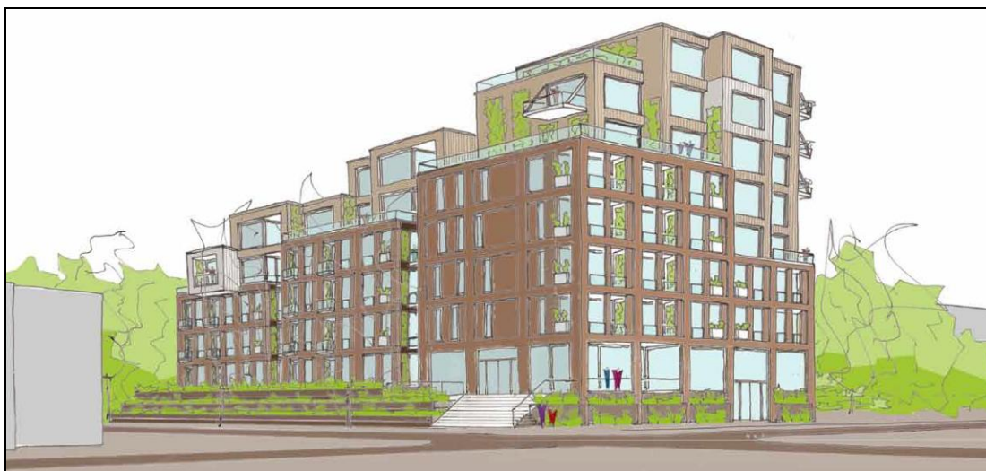
Figuur 3. Impresie van de plannen van Stationsweg 114 te Heerhugowaard.