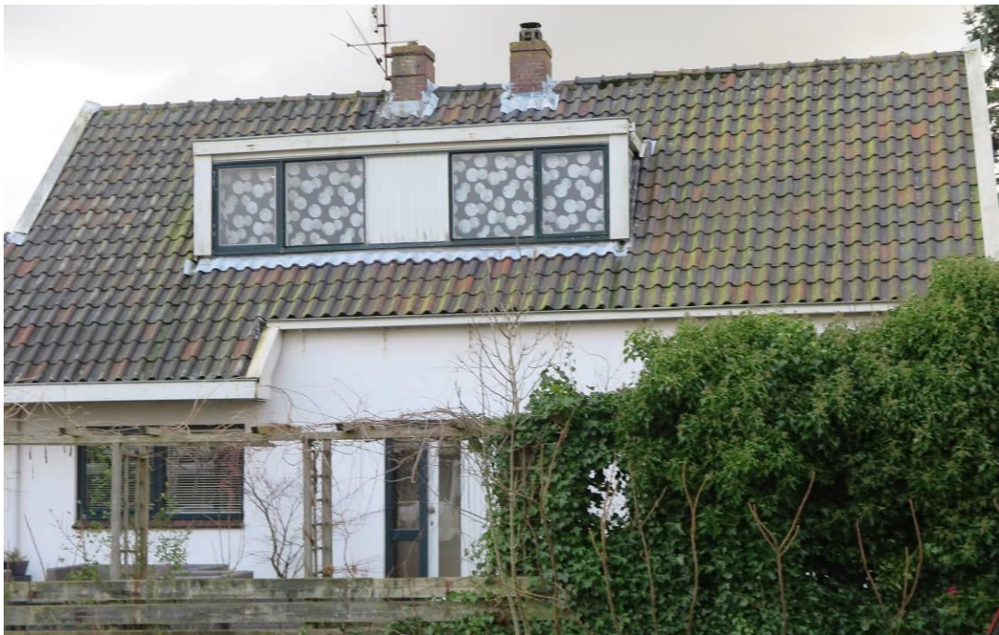
Vervolg figuur 2. Foto-impresie van het plangebied van het Stationsweg 114 te Heerhugowaard.