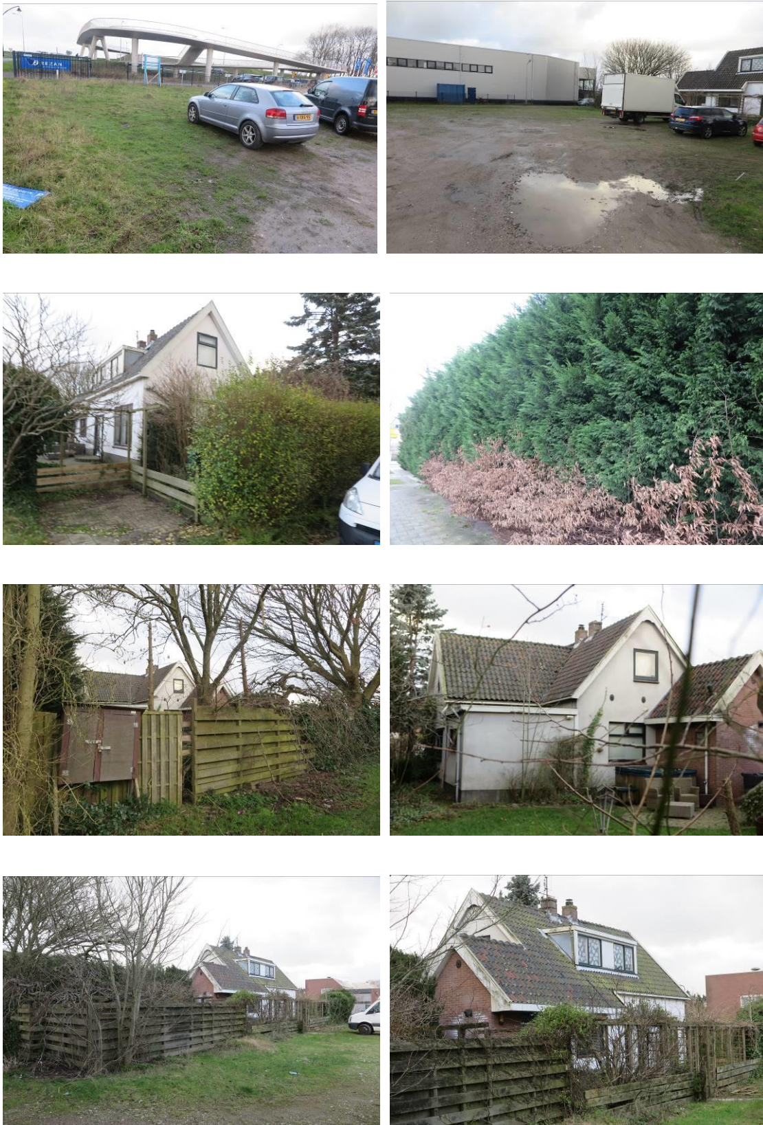
Figuur 2. Foto-impresie van het plangebied van het Stationsweg 114 te Heerhugowaard.