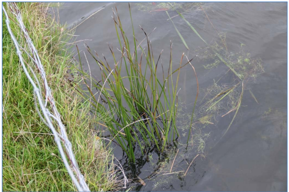
Zwanenbloem in het omliggende water dat niet behoort tot het plangebied.

Het onderzoeksgebied is niet geschikt voor andere beschermde diersoorten, in verband met het ontbreken van geschikt biotoop.