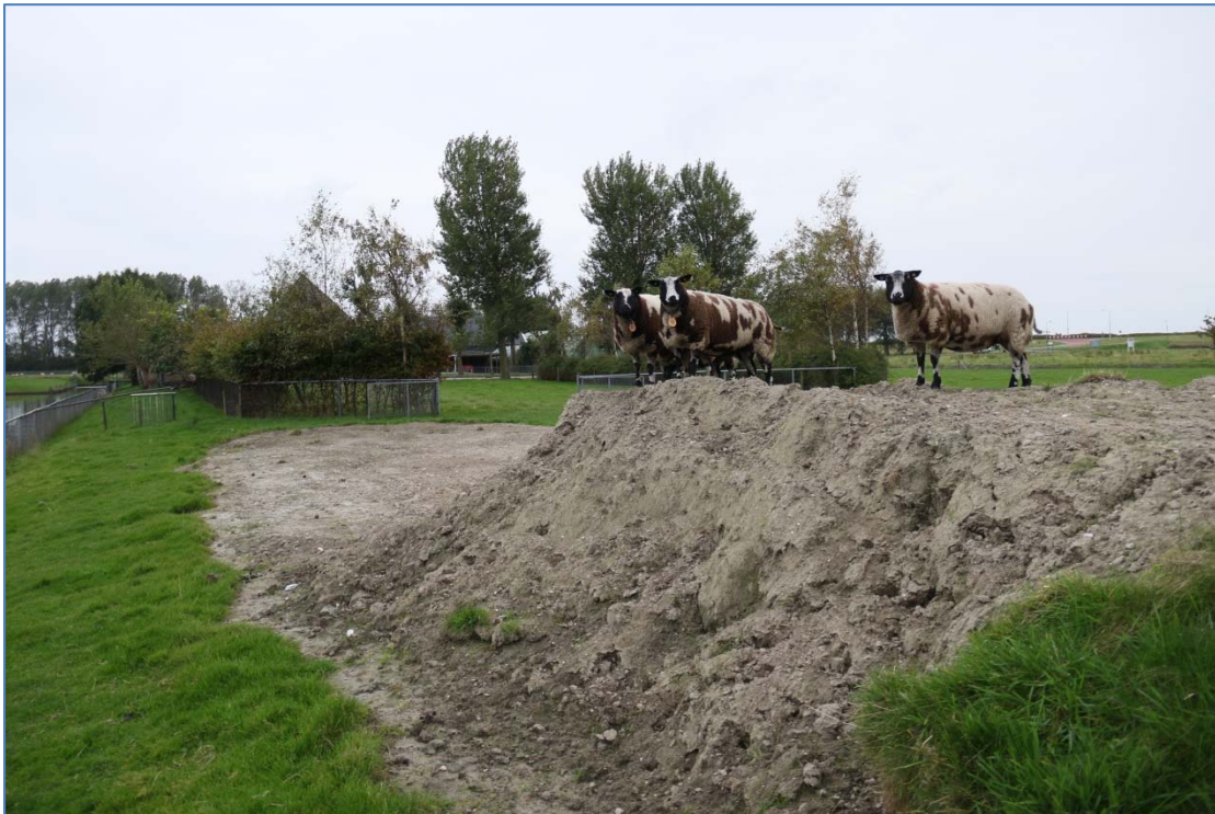
Her in te richten gedeelte van het plangebied.

Het plangebied is op 14 oktober bezocht om enerzijds de aanwezige en aangrenzende biotopen te beschrijven en anderzijds eventuele incidentele waarnemingen te doen van beschermde flora en fauna (voor zover waarneembaar). Op basis van de aangetroffen biotopen en informatie uit de vakliteratuur over populaties in de omgeving, is per soortgroep een inschatting gemaakt van het mogelijk voorkomen van in ieder geval die beschermde soorten waarvoor, indien aanwezig, ontheffing moet worden aangevraagd bij werkzaamheden in het kader van ruimtelijke inrichting en ontwikkeling.