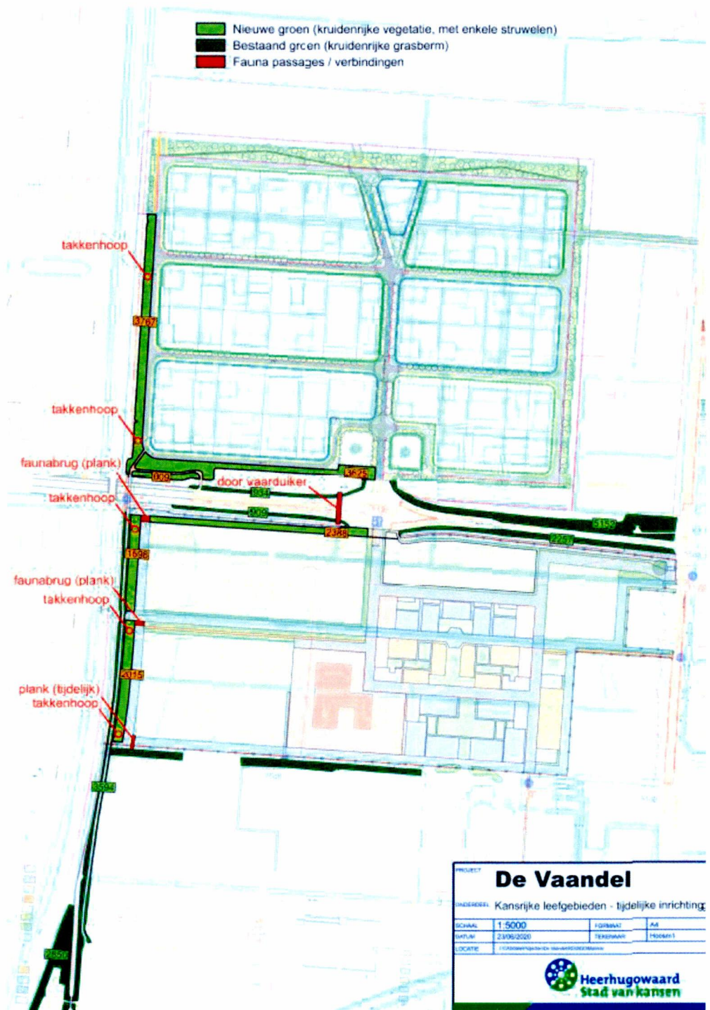
Figuur 1; locaties mitigerende maatregelen