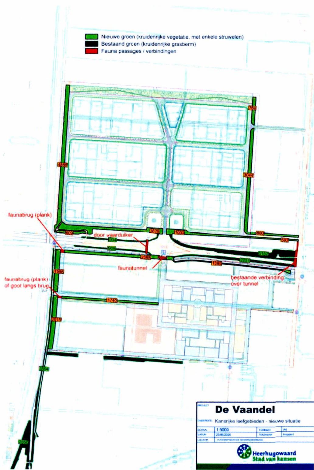
Figuur 2; Locaties compenserende maatregelen