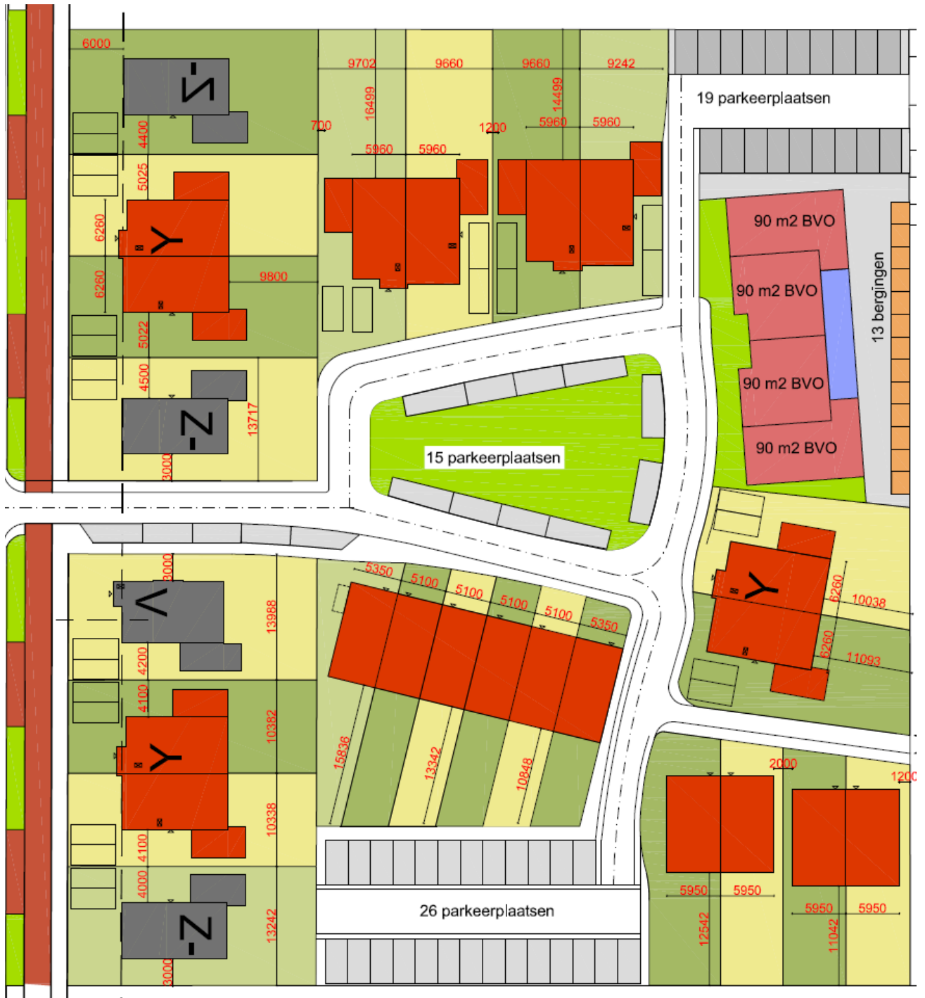
Concept verkaveling (ROW vastgoed)

In de toekomst wordt de locatie bebouwd met woningen.