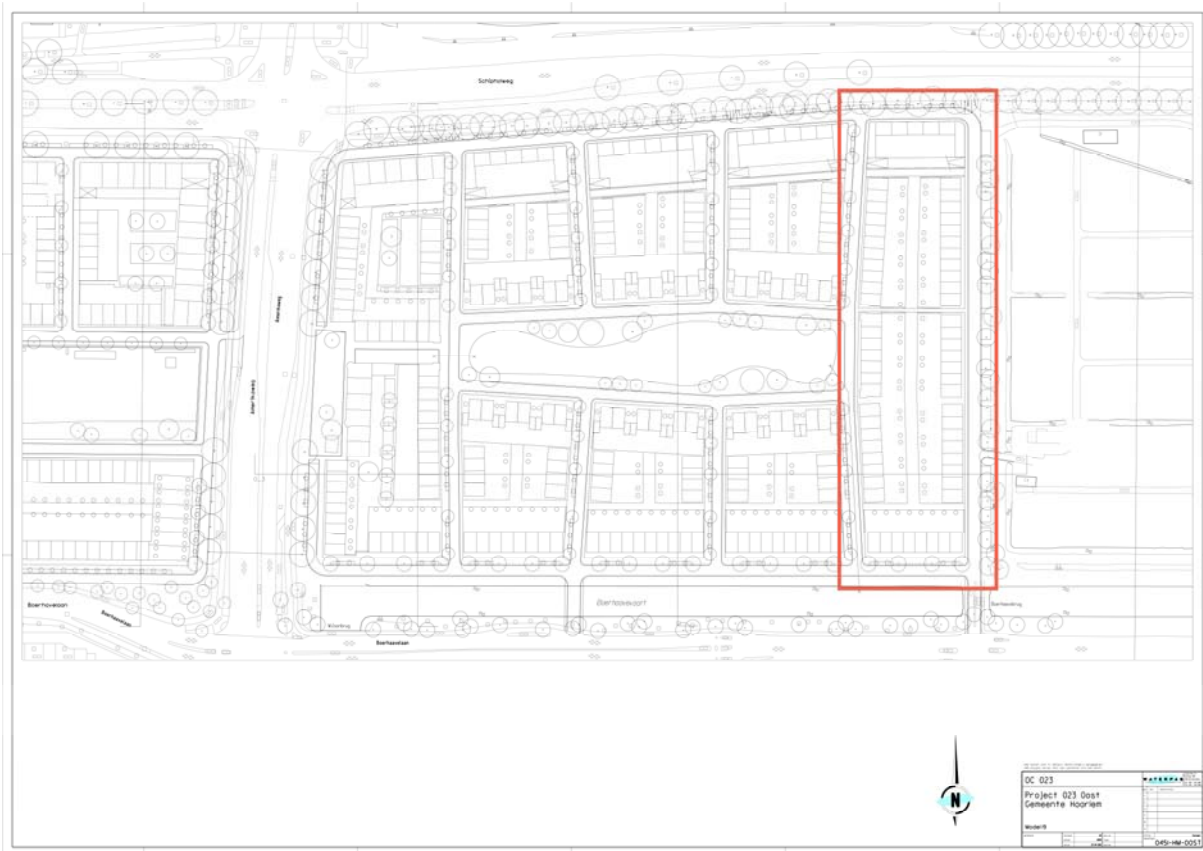
Figuur 2: Verkaveling met in rood het plangebied deel met een verhoogd archeologisch risico

Aan de oostzijde van onderhavig plangebied ligt een gebied met een vastgestelde hoge waarde dan wel verwachting waardoor het gezien de geplande ontwikkeling raadzaam is om tijdig in beeld te hebben wat daar precies archeologisch gezien aan de hand is. Figuur 1 geeft een uitsnede uit de gemeentelijke archeologische beleidskaart weer. In rood zijn noordoost-zuidwest verlopende strandwallen in de ondergrond weergegeven waarop al in een vroege fase gewoond en vertoefd is of kan zijn. Een vergelijking van verkavelingplan en deze kaart geeft aan dat in het meest oostelijke deel van het plan een dergelijke strandwal verwacht wordt dan wel al is aangetoond (figuur 2).