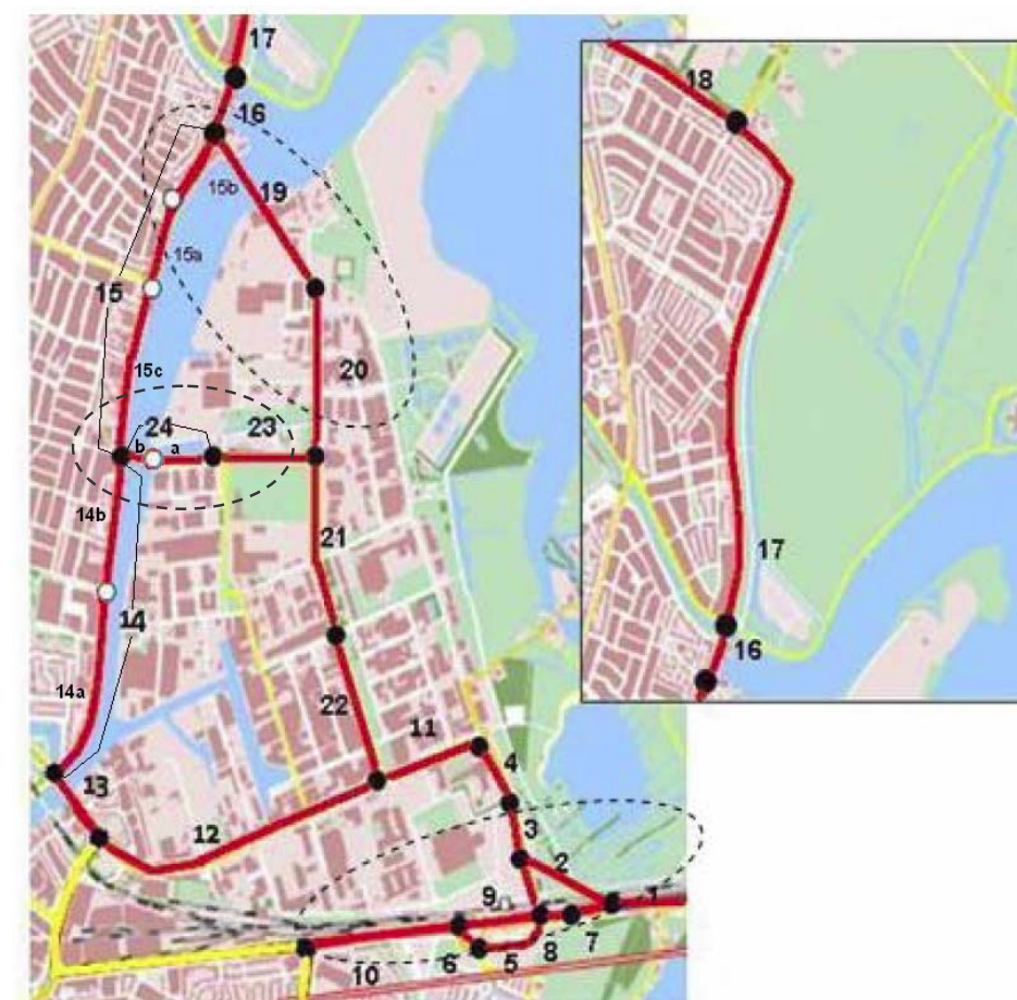
Figuur 2.2 Situering beoordeelde wegvakken

In navolgend figuur 2.2 is een plot weergegeven van de wegvakken die met CAR en/of ISL2 zijn doorgerekend in het kader van dit luchtkwaliteitonderzoek.