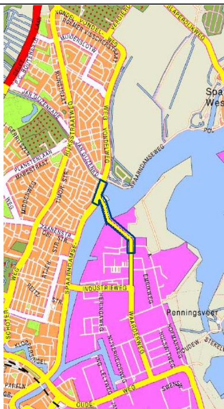
Figuur 2.1 Plangebied project Schoterbrug

Het plangebied is weergegeven in figuur 2.1.