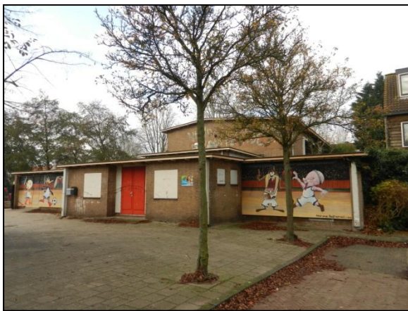
Figuur 3. Sporthal vanaf noordoostzijde.