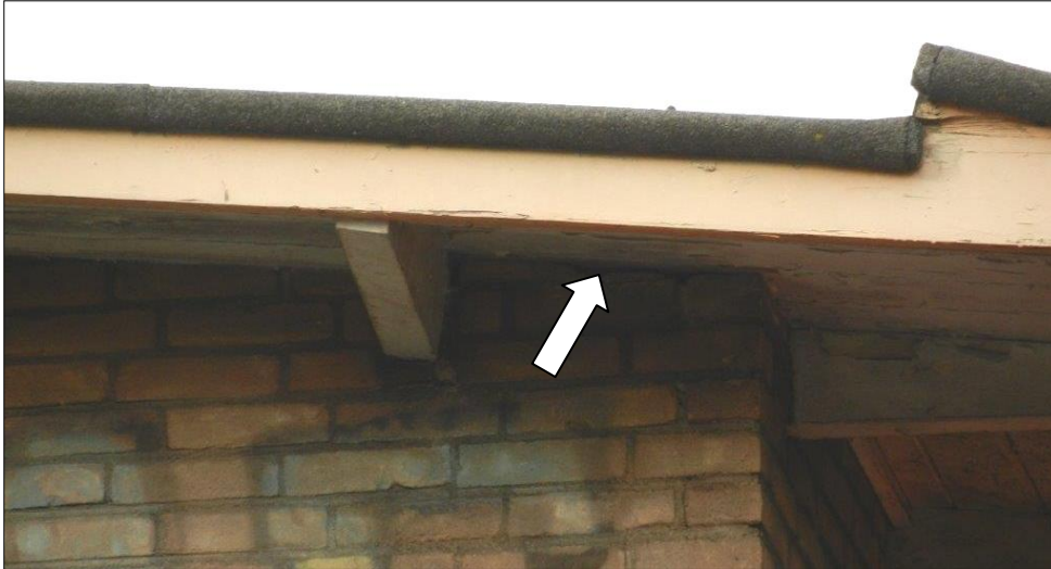
Figuur 6. Detail van de dakrand waarvan gewone dwergvleermuizen gebruik kunnen maken.

In figuur 6 is een foto opgenomen met een detail van de dakrand waarvan gewone dwergvleermuizen gebruik kunnen maken.