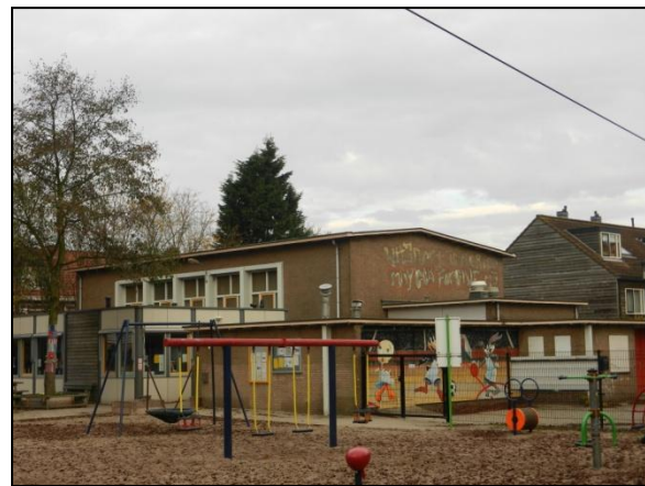
Figuur 4. Sporthal vanaf zuidoostzijde.