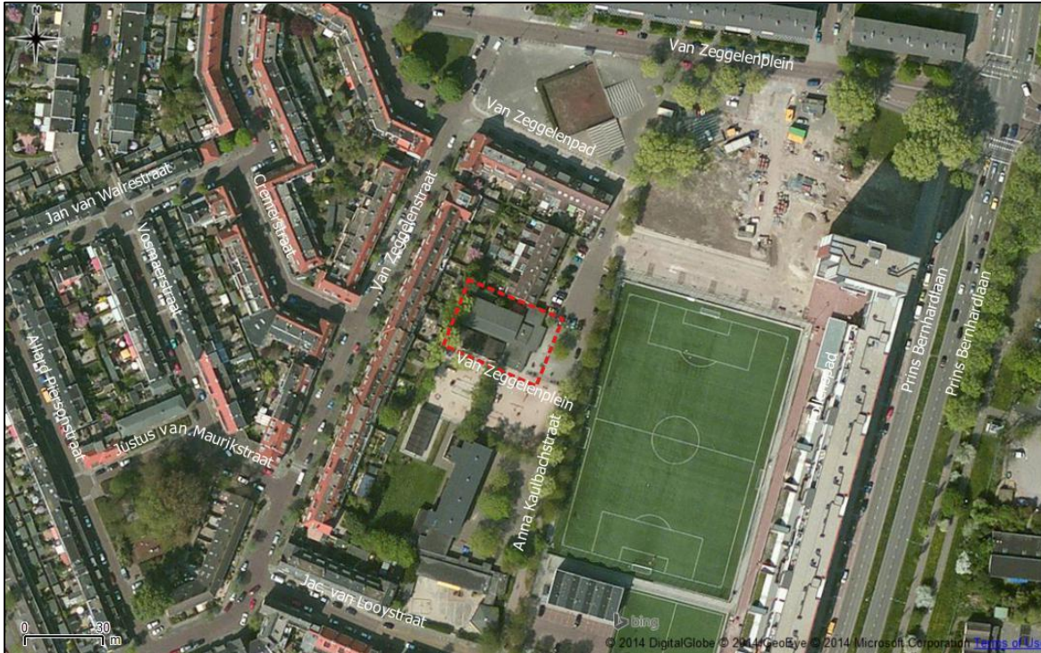
Figuur 2. Luchtfoto onderzoekslocatie en directe omgeving.