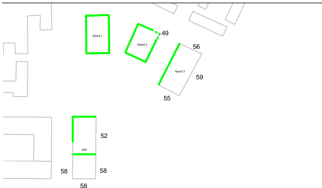
Figuur 6.2 Maximaal berekende geluidbelasting en geluidluwe gevels Concept B, groen = geluidluwe gevel, groen gestippeld = geluidluw op begane grond en 1e verdieping