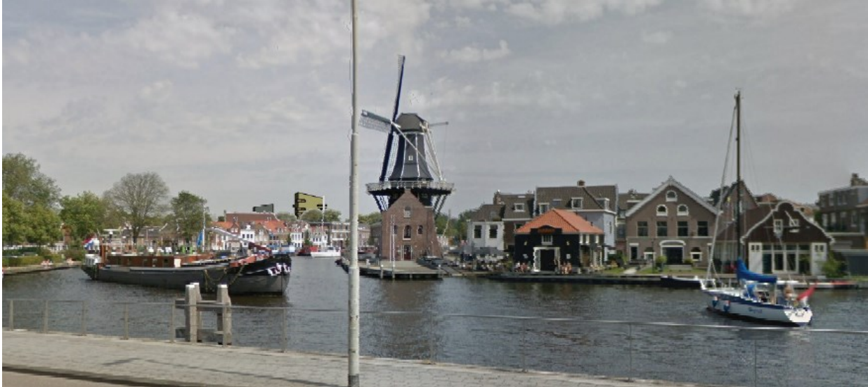
Afbeelding uit Gonnetstraat zonstudie, ENZO Architectuur en Interieur, 10-12-2018, iov HBB Ontwikkeling B.V., uitsnede gezichtspunt 11 Koudenhorn t.h.v. 66

3.3 Op het niveau van de Nieuwstad bestaat er vanuit cultuurhistorisch oogpunt binnen de bestaande waardevolle morfologie van de 17 de -eeuwse stadsuitleg geen aanleiding voor de voorgestelde schaa sprong in de hoogte. Zichtbaarheid en effecten van de woontorens op het silhouet is vanaf de meeste plekken beperkt. Dit geldt niet voor het beeld vanaf het Spaarne (zie o.a. de Koudenhorn t.h.v. 66). De ruimte van het Spaarne en het silhouet van de Nieuwstad wijzigt hier. Achter de bebouwing langs het Spaarne zijn de voorgestelde woontorens duidelijk zichtbaar.