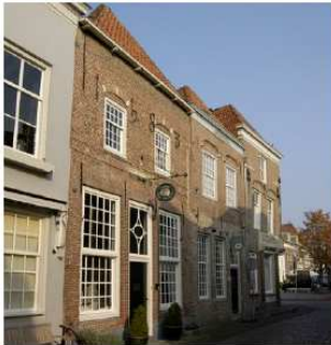
verschillende gevels, zelfde bouw- principe