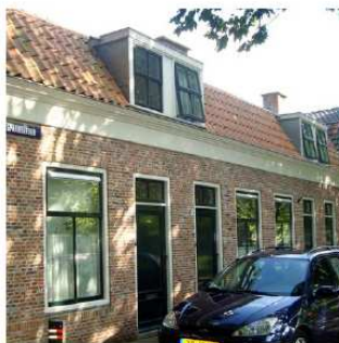
ingetogen ontwerp, zorgvuldige detaillering