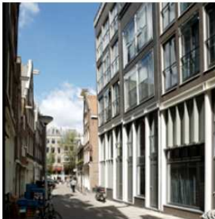
parcelering, wisselende beendi- ging, duidelijke plint, metselwerk met verticale ramen