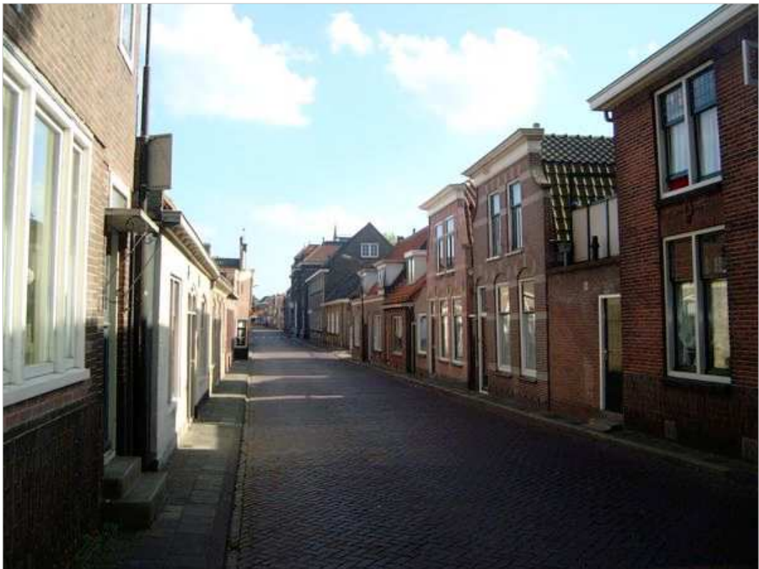
De Vijzelstraat: alle bebouwing overwegend in de rooilijn

Het binnenterrein, de tuin van het voormalige ziekenhuis, heeft een semi-openbaar karakter. Het monumentale zusterhuis centraal op het binnenterrein en de overige inrichting van het binnenterrein staat grotendeels ten dienste van het ziekenhuis-complex. Doordat het terrein als parkeerplaats voor de zorgfuncties wordt gebruikt komt de tuin niet goed tot z'n recht. In de binnentuin staan enkele behoudenswaardige bomen.