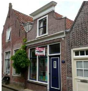
afwisselende bouwhoogtes en gevelvormen