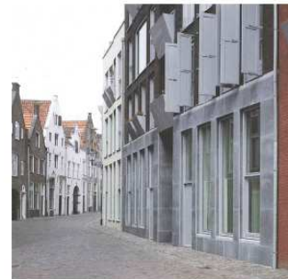
parcelering, duidelijke plint, met- selwerk met verticale ramen