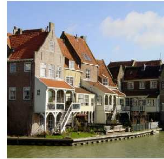
afwisselende bouwhoogtes en gevelvormen