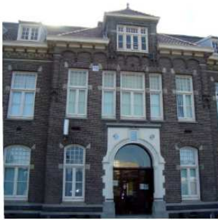
Rijksmonument; te spiegelen