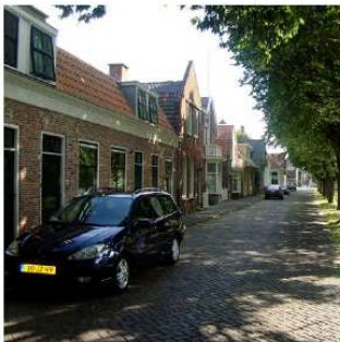
afwisselende kaprichtingen en kleuren