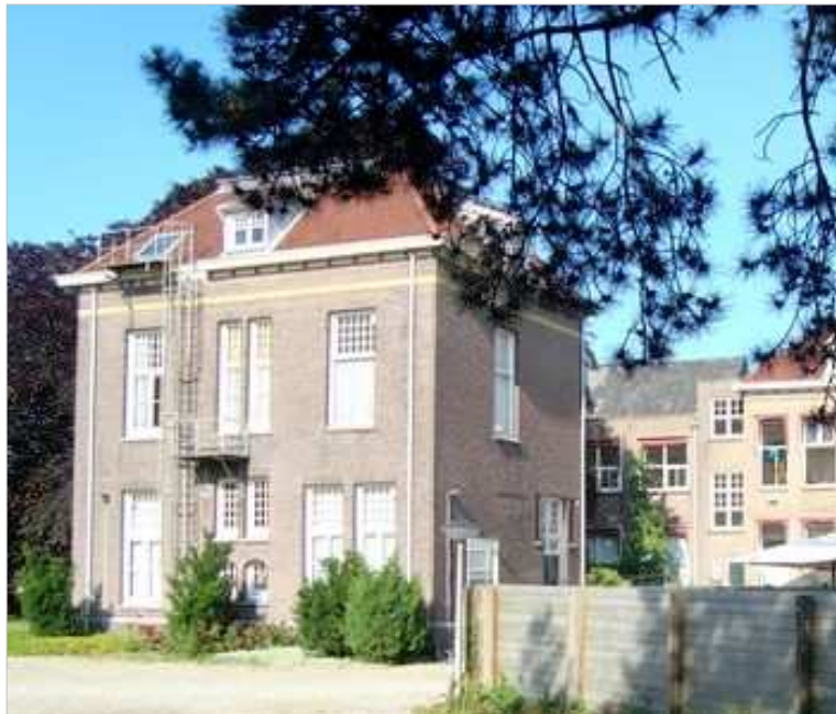
Het monumentale zusterhuis op het binnenterrein

Met de bouw van het ziekenhuiscomplex is in 1899 gestart in opdracht van de stichting Snouck van Loosen. Een jaar later waren de gebouwen voltooid. Later zijn aan het hoofdgebouw nieuwe vleu-