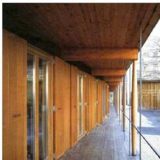
Voorbeelden van overgang tussen privé en (semi-)openbaar door veranda's