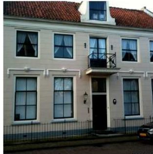
Dubbelpand tegenover stadhuis Enkhuizen: klassieke bouwstijl