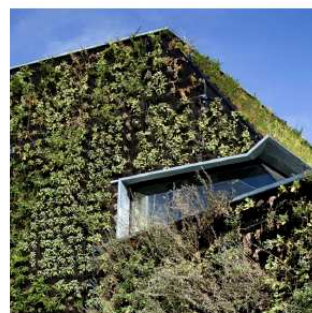
Voorbeelden van begroeide erfafscheidingen en/of wand bij de overgang naar bestaande woningen