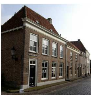
verfijnde beindiging gevel