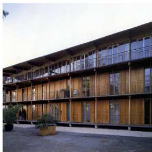
Voorbeelden van gevels van nieuwbouw in de Binnenwereld