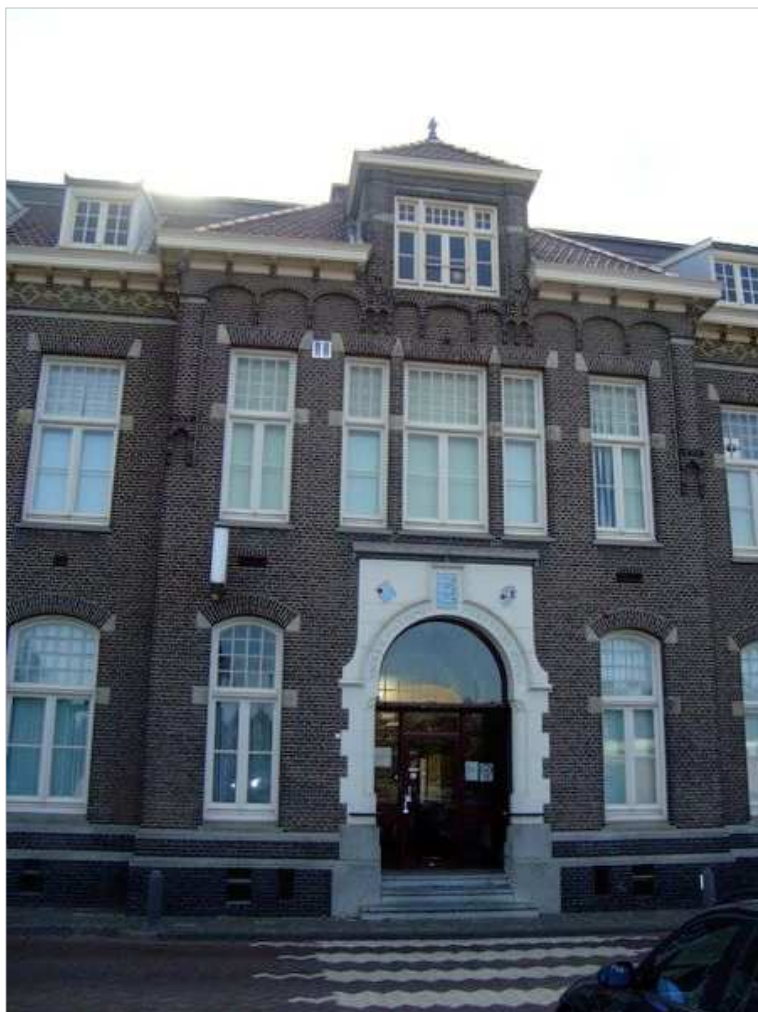
Entree beschermd Rijksmonument Vijzelstraat 24

Met uitzondering van de monumentale panden blijft de bouwhoogte in de omgeving van het plangebied veelal beperkt tot één bouwlaag met kap. De begane grondlaag is in de meeste gevallen hoger dan de verdieping. Bij de monumentale gebouwen is de begane grondlaag nog verhoogd, door de aanwezigheid van een souterrain en is tevens de eerste verdieping slaag hoger.