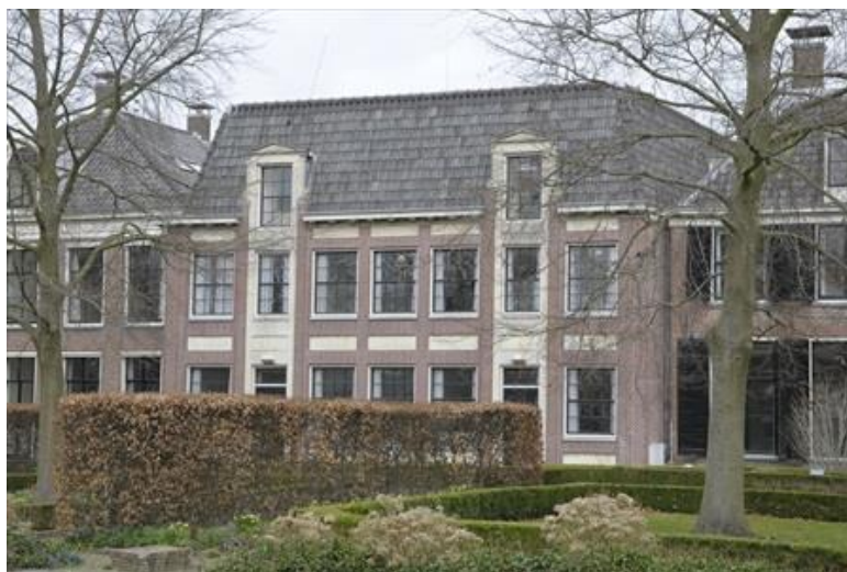
Voor- en achtergevel van Lingerzijde 35-37.