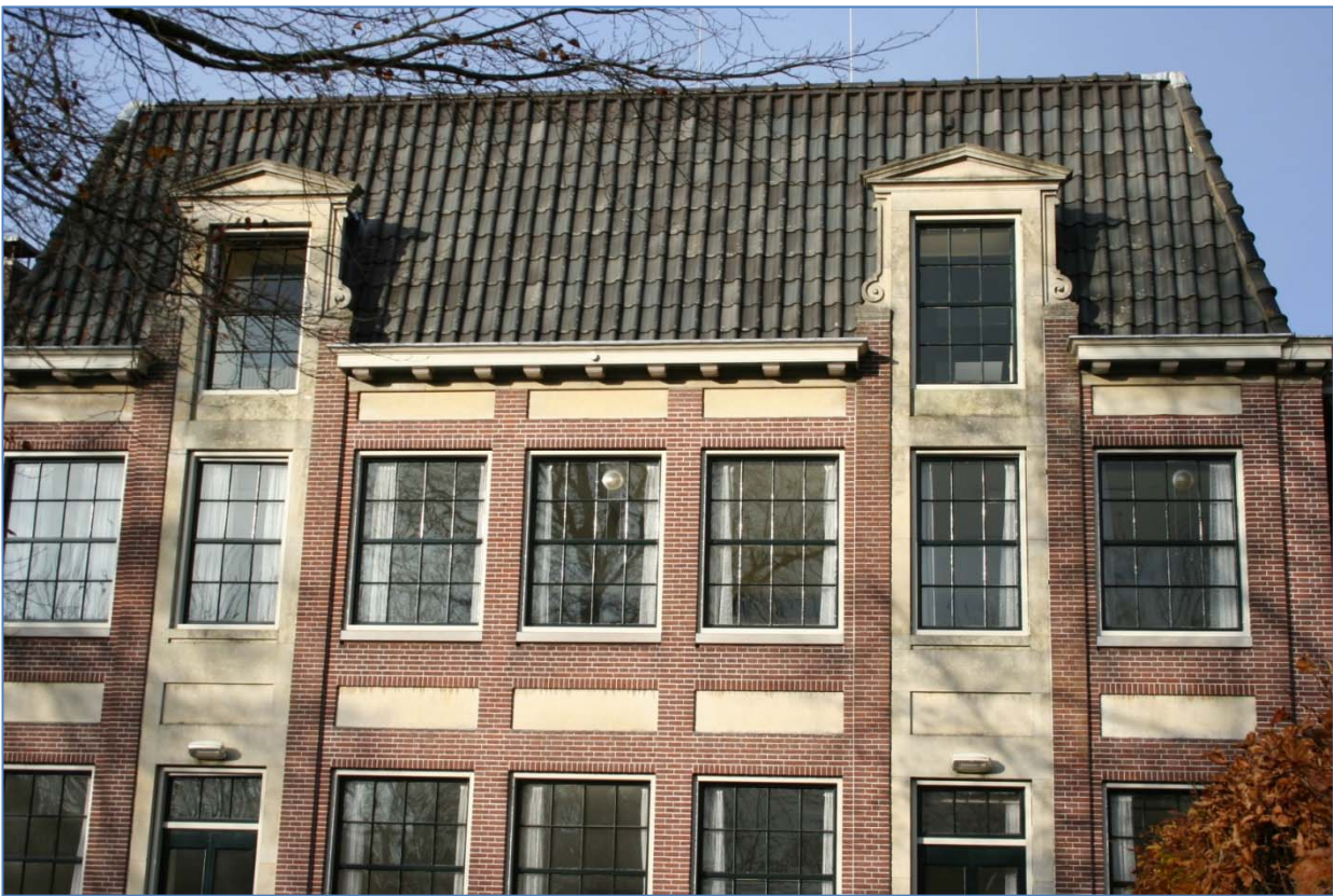
Monumentaal pand aan de Lingerzijde.

De panden liggen ingeklemd in de oude dichte bebouwing van het stadje Edam. Aan de achterzijde liggen een aantal parkachtige tuinen. De tuinen grenzen aan het water dat niet behoort tot het onderzoeksgebied.