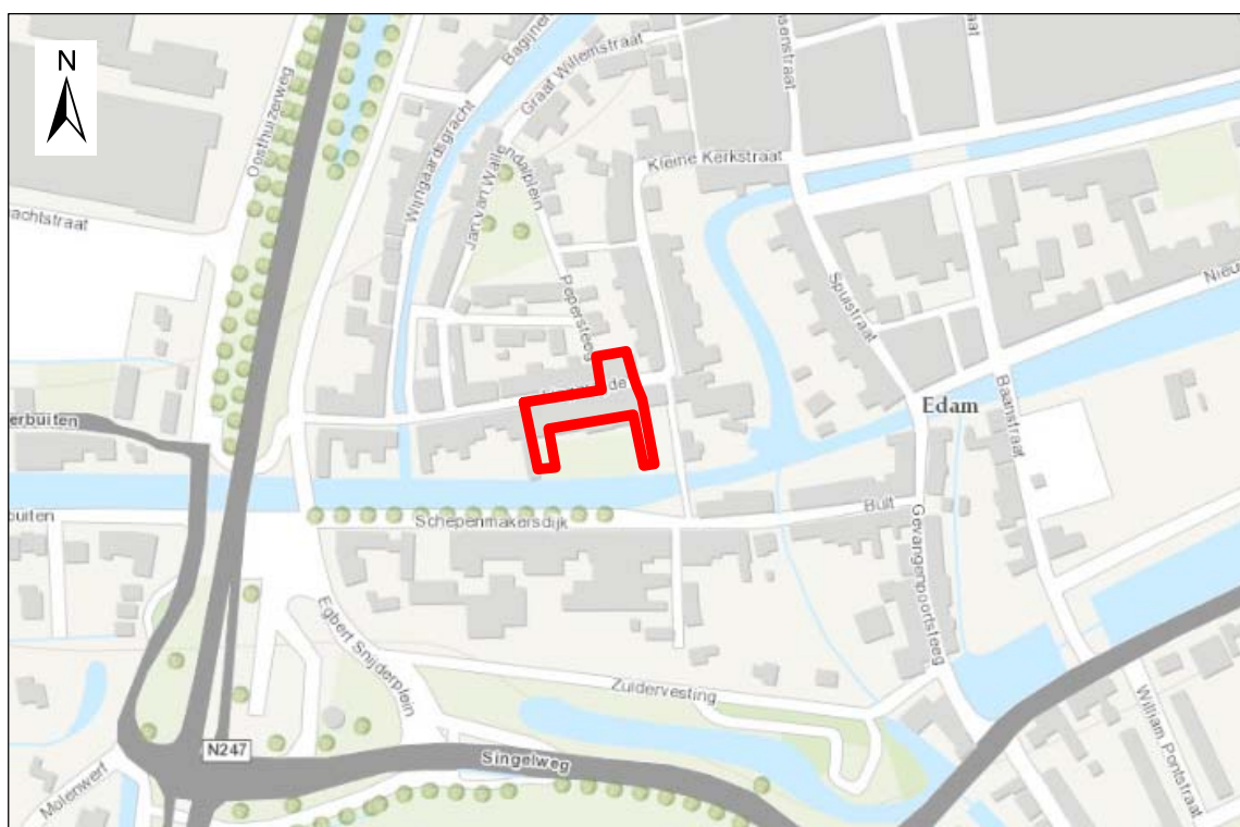
Figuur 1. Ligging van plangebied Lingerzijde te Edam

Het onderzoek heeft bestaan uit een veldbezoek.