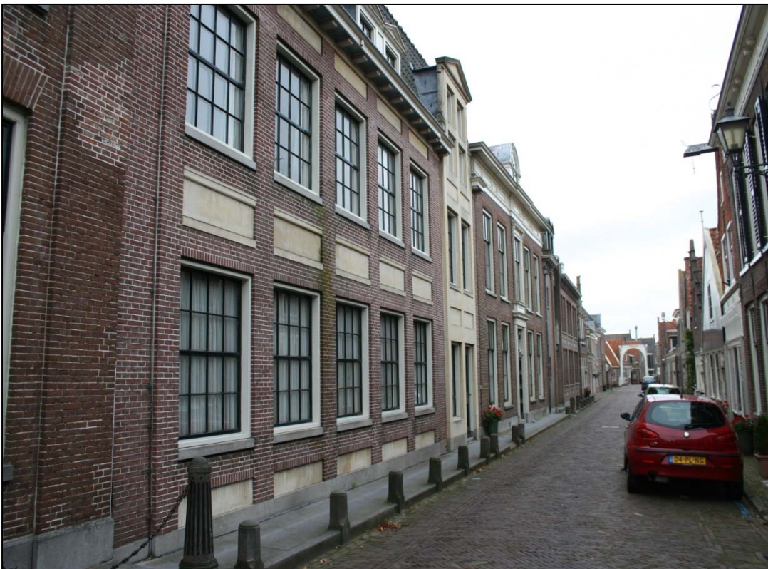
Panden langs de Lingerzijde te Edam.

In de pannendaken van de panden zouden mogelijk wel gebouw bewonende vleermuizen kunnen verblijven tussen de pannen en de dakbetimmering. Te