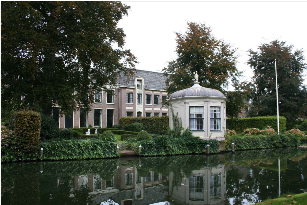
Aan de achterzijde van de huizen zijn parkachtige tuinen aanwezig

Het onderzoeksgebied is niet geschikt voor andere beschermde diersoorten, in verband met het ontbreken van geschikt biotoop.