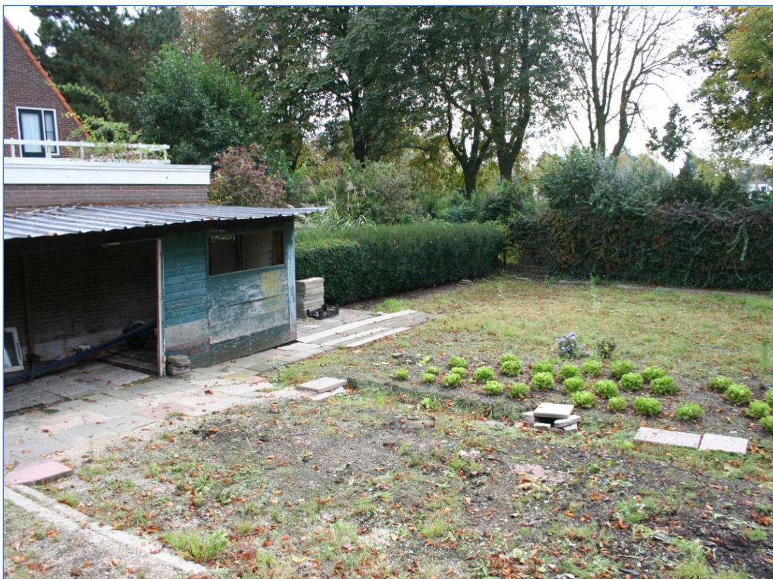
Overzicht van het terrein aan de Doelenstraat te Edam.

Vogels vallen onder het zwaardere beschermingsregime van de Flora- en faunawet. Men dient activiteiten waarbij nesten verstoord kunnen worden buiten het broedseizoen plaats te doen vinden, dus niet van 15 maart tot 15 juli.