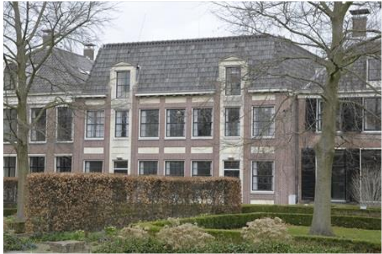
Voor- en achtergevel van Lingerzijde 35-37.