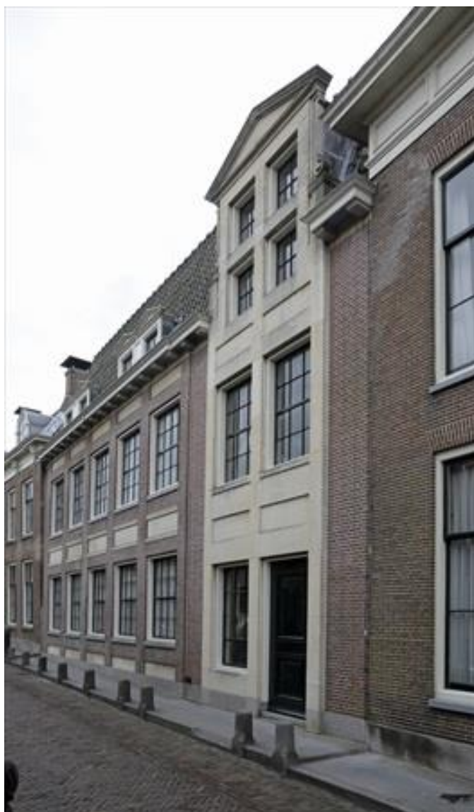
Voorgevel van Lingerzijde 35-37