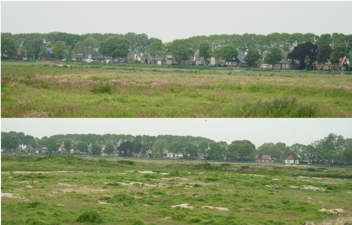
Figuur 1.3b Indruk van het plangebied