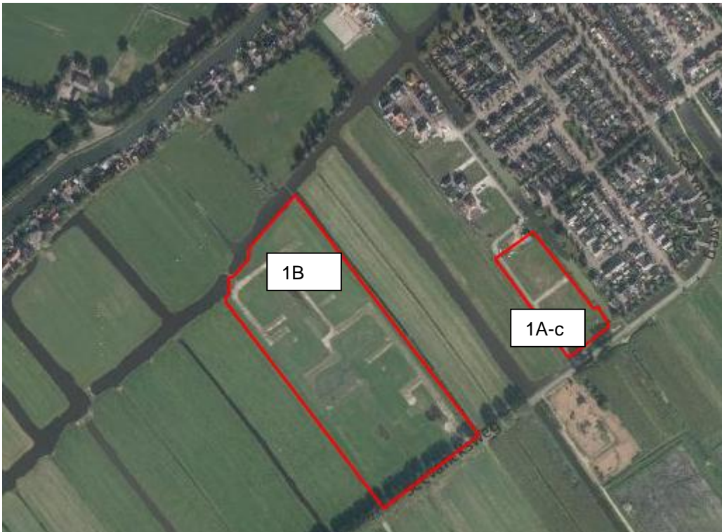
Figuur 1.3a Ligging plangebied (rode contour)

Plangebied 1B ligt braak, waarvan de toplaag grotendeels is afgegraven. Plangebied 1A-c betreft tevens een braakliggend terrein met kort gemaaid gras en een enkele verharde toerit.. In figuur 1.3 zijn enkele foto's van het plangebied weergegeven.