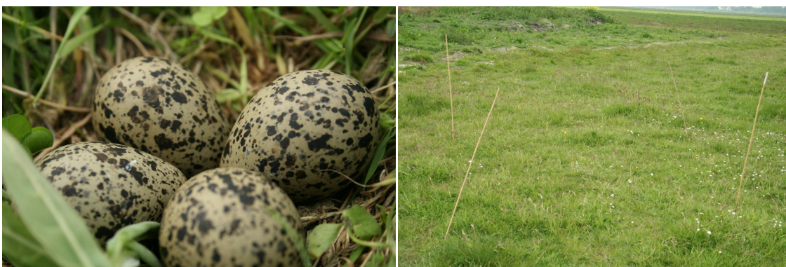
Figuur 2.4, weidevogelnesten in plangebied 1B

Er zijn geen jaarrond beschermde nesten van vogels aangetroffen in het plangebied. In de indirecte omgeving buiten de invloedssfeer van het plangebied zijn bomen aanwezig waar vogels in kunnen broeden en woningen waar de huismus en gierzwaluw onder daken kan broeden. Het plangebied maakt geen wezenlijk onderdeel uit van leefgebied behorende bij jaarrond beschermde nesten, zoals van de huismus of gierzwaluw of andere categorie 1 t/m 4 beschermde vogels.