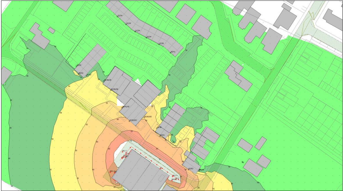
Figuur 2: rekenresultaten

In figuur 2 zijn de rekenresultaten inclusief aanvullende voorzieningen opgenomen, waaruit blijkt dat binnen het stedenbouwkundig planontwerp mogelijkheden zijn om akoestisch verantwoord te kunnen bouwen bij de uitgangspunten voor het bedrijf AT Schut zoals aangegeven.