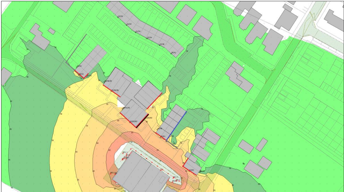
Figuur 1: locatie dove gevels

In de onderstaande figuur 1 is met rood aangegeven welke gevels als dove gevels dienen te worden uitgevoerd. In blauw zijn de gevels aangegeven die op de begane grond niet als dove gevel hoeven te worden uitgevoerd, maar op de verdieping wel.