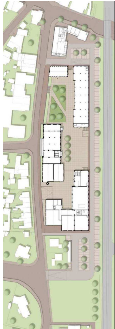
Figuur 3. Impressie van de plannen Bensdorp.