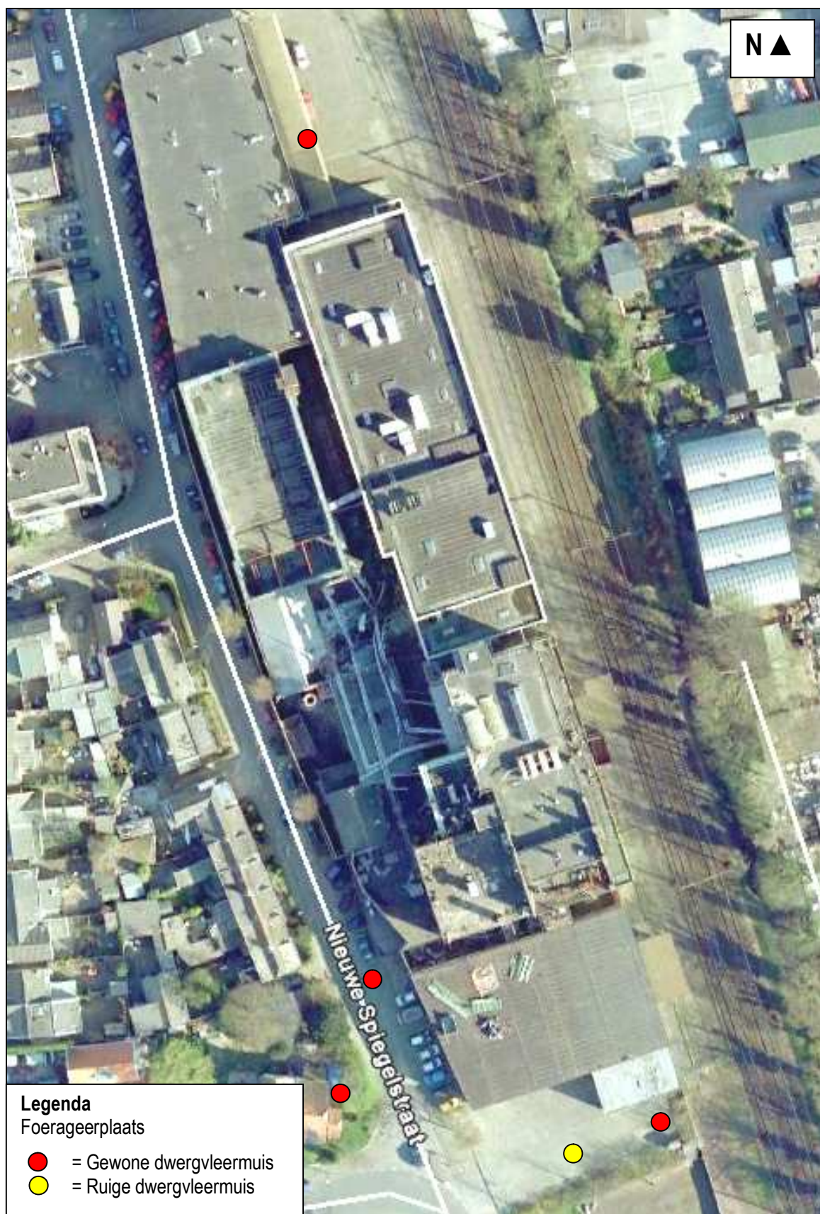
Figuur 5. Waarnemingen van vleermuizen in de voorherfst van 2015 ter plaatse van en direct rond Bensdorp.