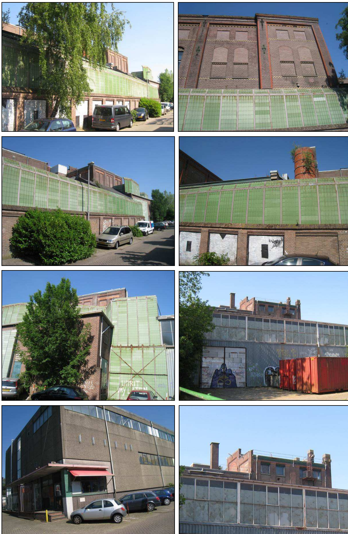
Figuur 2. Foto-impresie van de huidige situatie Bensdorp te Bussum.