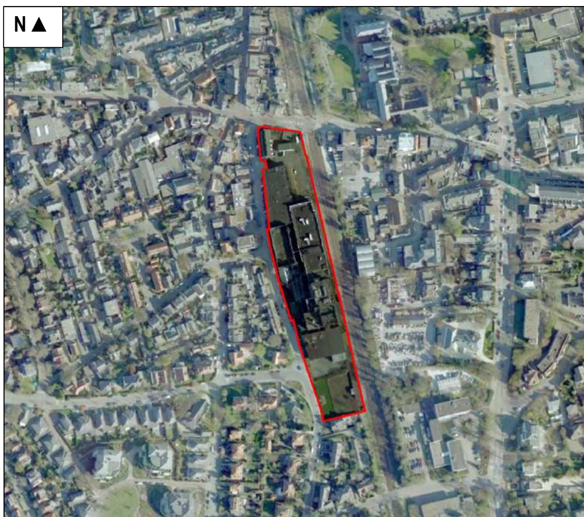
Figuur 1. Globale ligging van het plangebied Bensdorp te Bussum (rood).

Het plangebied is gelegen tussen de Nieuwe Spiegelstraat en het spoor te Bussum. Dit gebied bestaat uit grotendeels leegstaande bedrijfsbebouwing. In figuur 2 wordt een foto impressie gegeven van het plangebied.