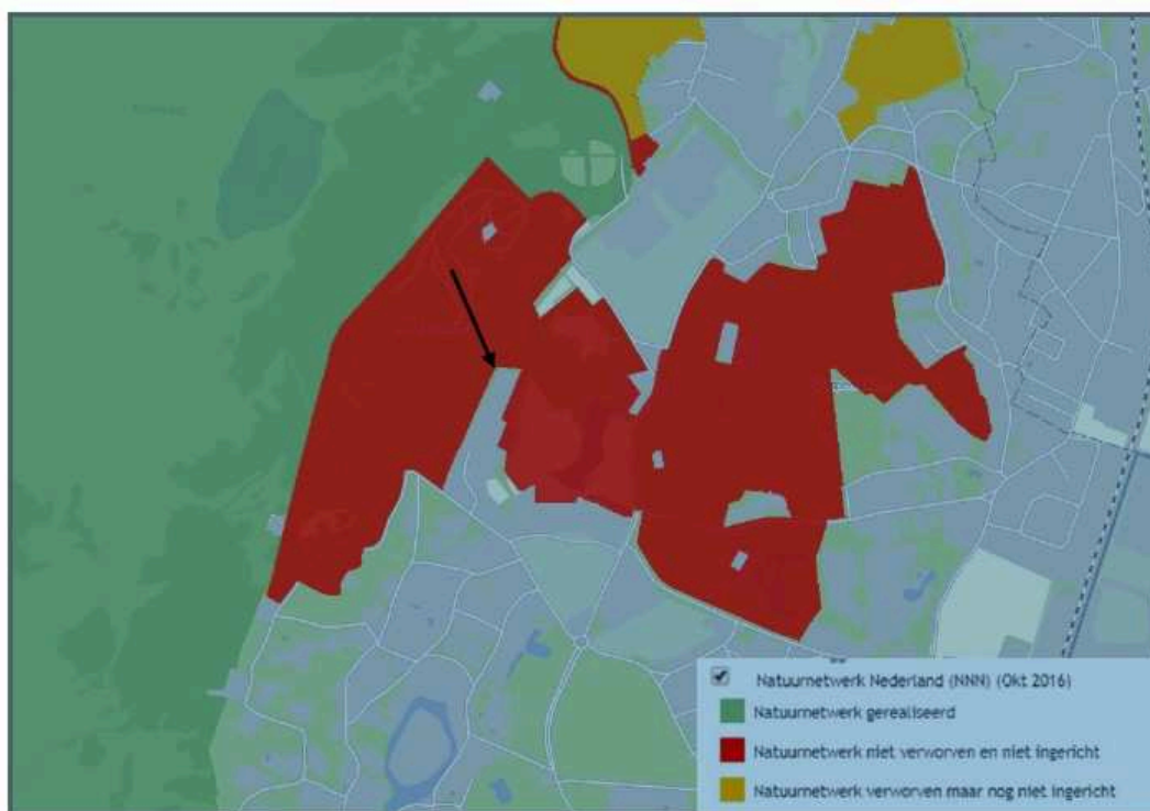
Fig. 24. Planologische gebiedsbescherming, Natuurnetwerk Nederland (voorheen EHS). De zwarte pijl geeft de locatie van het onderzoeksgebied aan.

Door de ontwikkeling zullen wezenlijke kenmerken van de provinciale groenstructuur op gelijke wijze worden aangetast dan bij de wettelijke gebiedsbescherming. In de planvorming voor het gebied moet op identieke wijze rekening gehouden te worden met planologische bescherming van natuurwaarden. Vervolgonderzoek in het kader van het Natuurnetwerk Nederland is echter niet noodzakelijk.