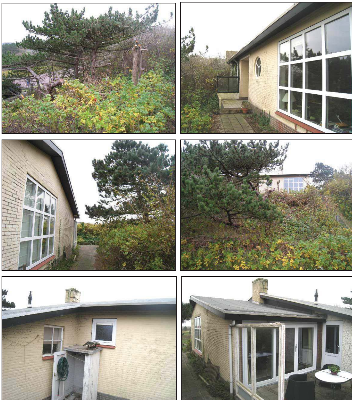
Figuur 2. Aanzicht van Zeeweg 17 te Bergen aan Zee.