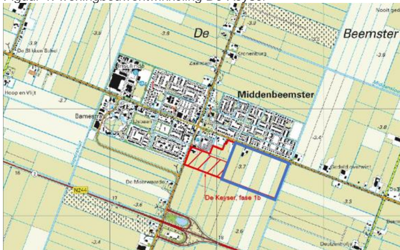
Figuur 1: woningbouwontwikkeling De Keyser

In verband met het opstellen van een bestemmingsplan voor de Keyser fase 2 is het noodzakelijk dat de verkeersparagraaf wordt ingevuld. In dit kader moet de uitvoerbaarheid van het plan op o.a. het gebied van verkeer worden aangetoond.