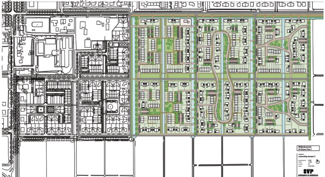
Figuur 2: stedenbouwkundig plan De Keyser fase 2