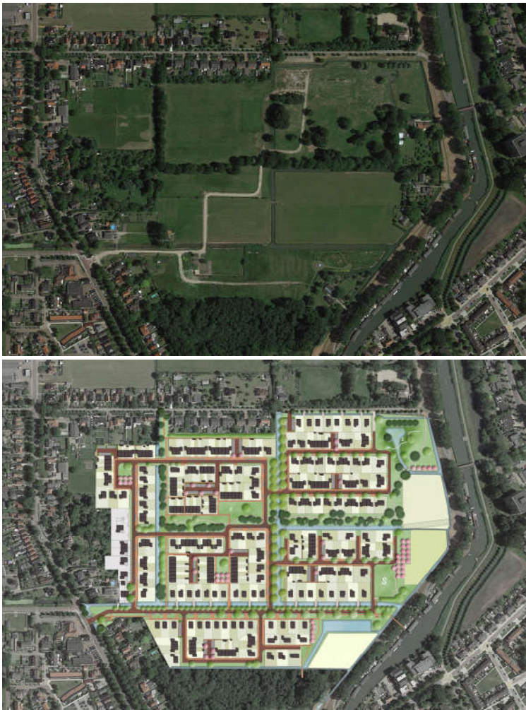
Afbeelding 4: luchtfoto gebied De Nieuwe Tuinderij Oost en stedenbouwkundig plan (SVP)

pad vormt vanaf de Purmerenderweg, net als het Noorder- maar ook het Zuiderpad, een open oostwest-lijn waaraan in de sfeer van de tuinders- en rentenierswoningen, nieuwe woningen zijn gedacht. De twee noordzuid-lopende sloten in het plangebied zijn opgenomen in de hoofdstructuur. Er is hierbij in inrichting een onderscheid gemaakt tussen de sloot midden door het plan, die als hoofdsloot op de historische kaarten staat en de sloot achter de Purmerenderweg, die op de oude kaarten in hierarchie minder zwaar is aangezet. Beide sloten worden in de wijk open groene zones tussen het Noorder- en Middenpad. Maar de hoofdsloot krijgt door openbare taluds met voetpaden langs het water een volledig openbaar karakter in de wijk. En de subsloot wordt aan één zijde openbaar. Beide sloten blijven zichtbaar en herkenbare elementen in de wijk.