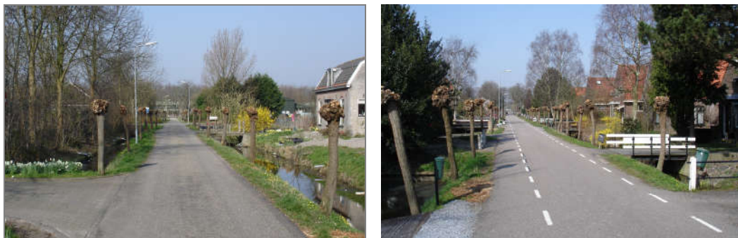
Afbeelding 3: Zicht over Zuiderpad richting snelweg A7 en over Noorderpad richting Ringdijk

Zuidersloot, het Noorderpad en de Volgerweg werd door de snelweg en later door de geluidschermen verstoord.