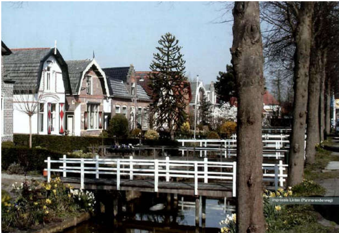
Figuur 3.1 Impressie lintbebouwing (Purmerenderweg)

In figuur 3.1 is een impressie van de inrichting van lintbebouwing weergegeven.