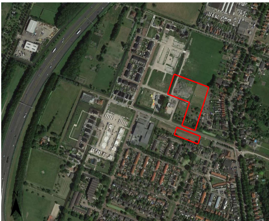
Figuur 1.1: Ligging plangebied

Het plangebied ligt ten noorden van de kern Zuidoostbeemster, in de gemeente Beemster. Het plangebied kent twee deelgebieden. Het noordelijke deelgebied grenst aan de zuidzijde aan het Middenpad en aan de noordzijde aan het te ontwikkelen plandeel 'Benonistraat' waarvan het bestemmingsplan inmiddels onherroepelijk is. Aan de westzijde zijn de woningen in fase 1 voltooid en zijn de fasen 2, 3 en 4 in aanbouw. Aan de oostzijde zijn, op enige afstand, de bestaande woningen aan de Purmerenderweg gesitueerd. Het zuidelijk deelgebied ligt tussen het Middenpad en de Van der Hoekstraat.