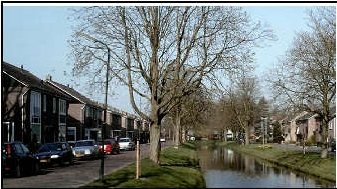
Figuur 3.2 Impressie buurten (Prinses Wilhelminasingel)

In figuur 3.2 is een impressie van de inrichting van een buurt weergegeven.