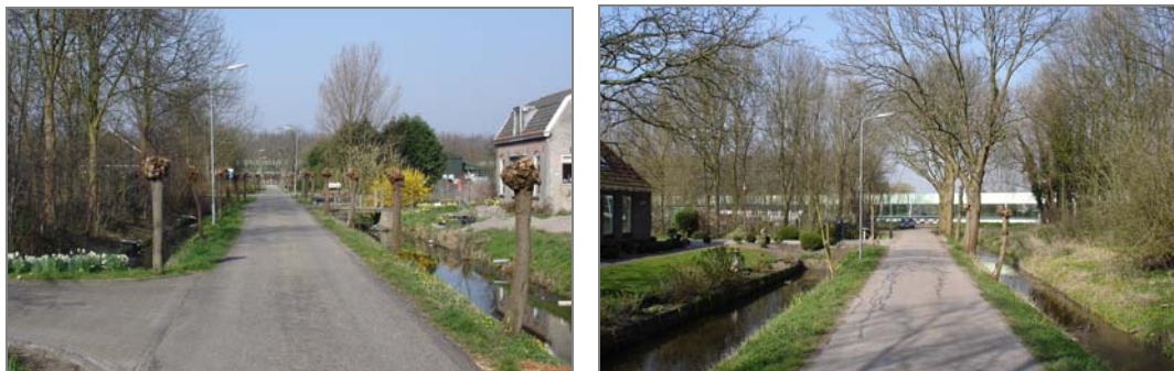
Afbeelding 3: Zicht over Zuiderpad en Noorderpad richting snelweg A7

bijzondere situatie van het dorp Zuidoostbeemster verder versterkt. Het zicht over het Zuiderpad, de Zuidersloot, het Noorderpad en de Volgerweg werd door de snelweg en later door de geluidschermen verstoord.