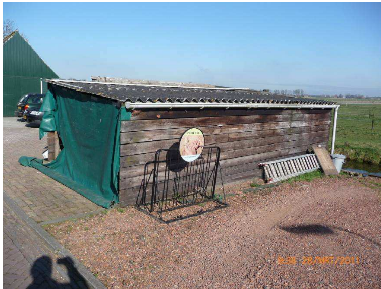
Gebouw A Oostgraftdijk 92