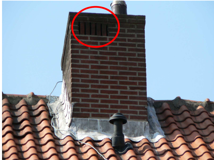
Aanwezige ventilatieroosters in de woonblokken

Tevens is het aangrenzende terrein aan het plangebied geschikt als foerageergebied en als vliegroute. Zie hiervoor de onderstaande afbeelding.