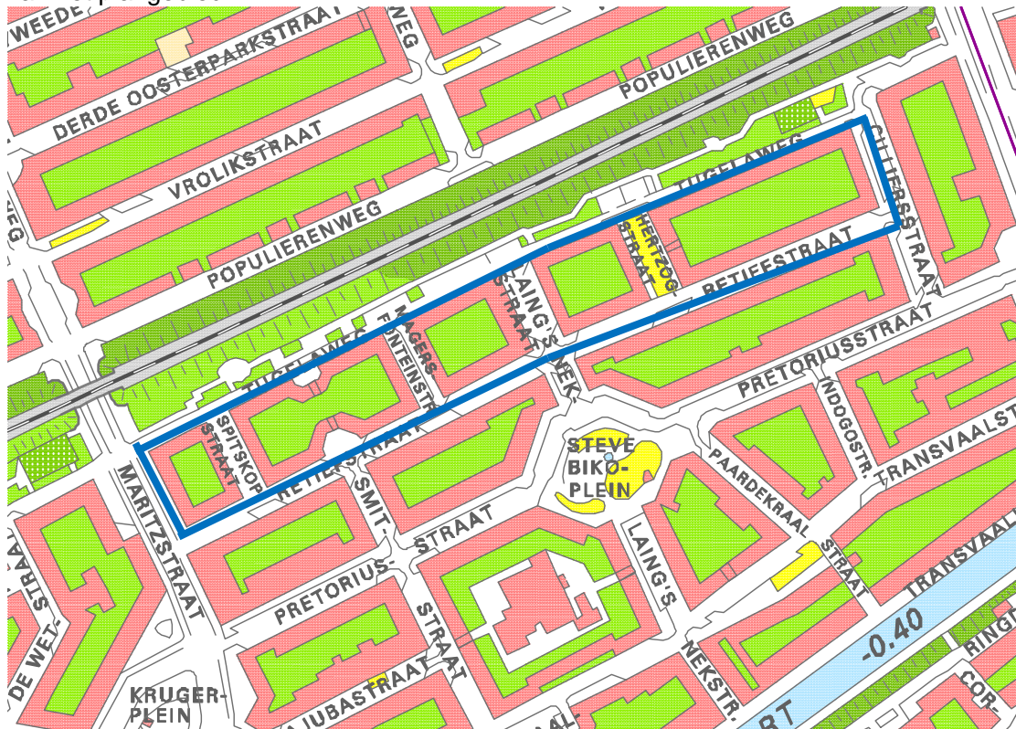
Ligging van het plangebied

Het onderzoeksgebied bestaat uit de vijf woonblokken gesitueerd tussen de Tugelaweg, de Maritzstraat, de Retiefstraat en de Cilliersstraat. Zie de onderstaande afbeelding voor de ligging van het plangebied.