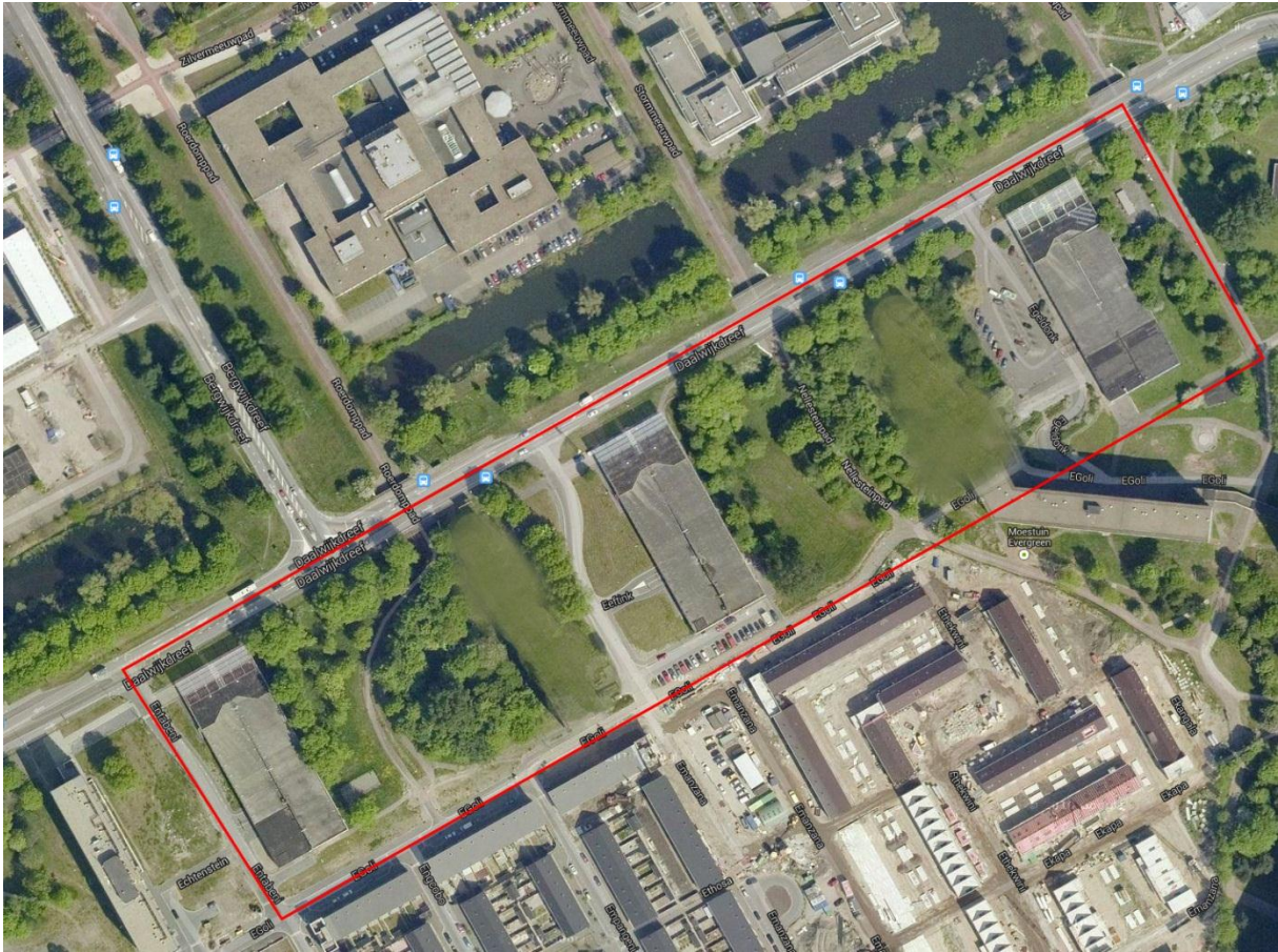
Het onderzochte projectgebied

Het projectgebied ligt in stadsdeel Zuidoost in de gemeente Amsterdam en wordt grofweg begrensd door de Daalwijkdreef, Egeldonk, EGoli en Entabeni. Zie de onderstaande afbeelding voor het onderzochte projectgebied.