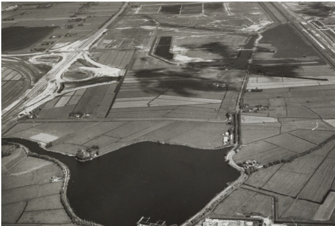
PW 1972 – Luchtfoto ten tijde van de aanleg van knooppunt Holendrecht tussen de A2 en de A9. Aan de gewenste aansluiting op knooppunt Muiderberg ter hoogte van Muiden is hier een duidelijk begin gemaakt. Herkenbare elementen zijn het Abcouder Meer en de Abcouderstraatweg met een dubbele bomenrij. Het destijds geplande wegdeel in natuurgebied Klarenbeek is te zien als een zwarte streep, haaks op de Abcouderstraatweg.