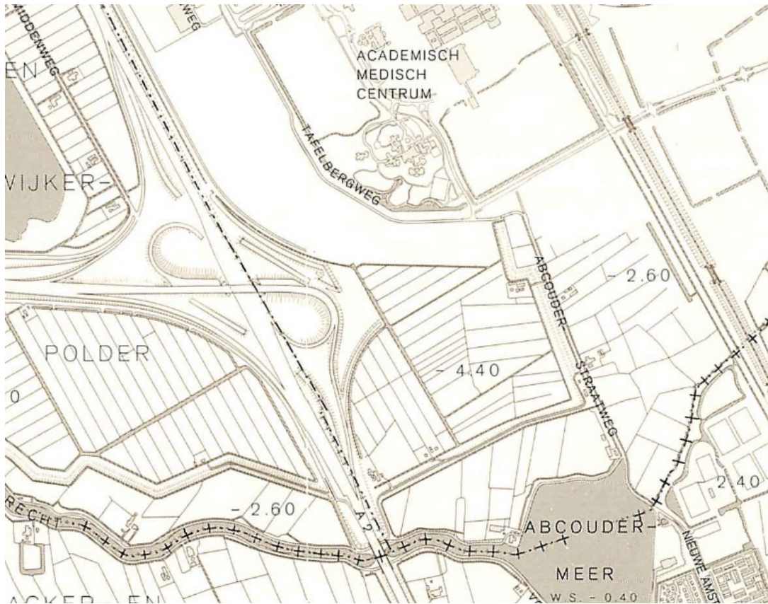
PW 1983 – Het huidige plangebied De Hoge Dijk bevindt zich ten oosten van de snelweg en het knooppunt Holendrecht. De oorspronkelijk beoogde aansluiting op knooppunt Muiderberg (A1 en A6) is zichtbaar.