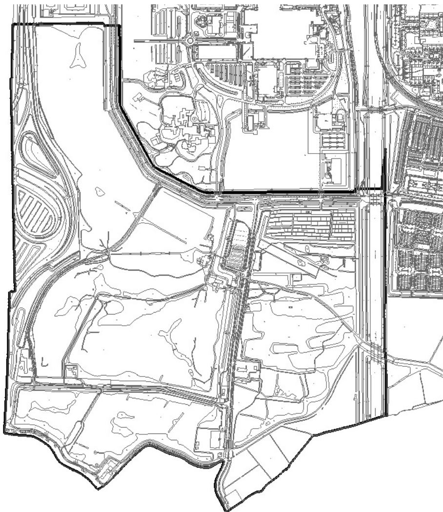
Stadsdeel Zuidoost – Plangebied De Hoge Dijk.

Bij cultuurhistorische waarden gaat het over (de positieve waardering van) sporen, objecten, patronen en structuren die zichtbaar of niet zichtbaar onderdeel uitmaken van onze leefomgeving en een beeld geven van een historische situatie of ontwikkeling. In veel gevallen bepalen deze cultuurhistorische waarden de identiteit van een plek of gebied en bieden ze aanknopingspunten voor toekomstige ontwikkelingen. Het is meestal niet nodig alle cultuurhistorische elementen aan te wijzen als beschermd monument of gezicht. Het is wel van belang dat cultuurhistorische waarden worden betrokken in de planvorming en worden meegewogen in de besluitvorming over de inrichting van een gebied. De plangrenzen zijn op onderstaande kaart ingetekend.