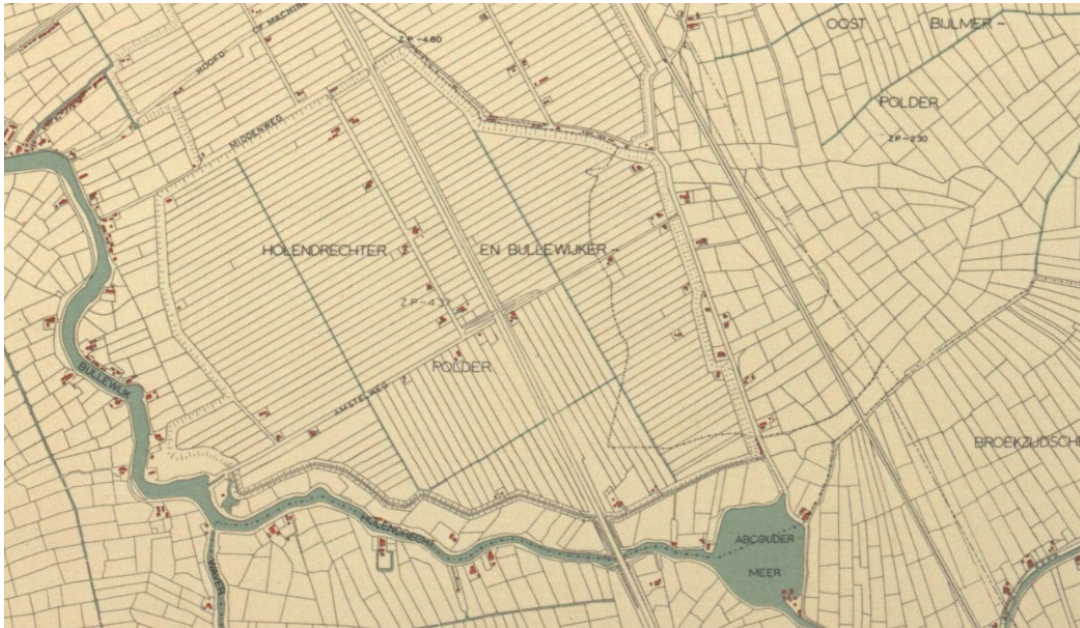
PW 1961 – Het gebied is nog nagenoeg identiek aan dat op de kaart van rond 1900. Wel is hier Rijksweg 2 al te zien, die enkele jaren eerder werd aangelegd.