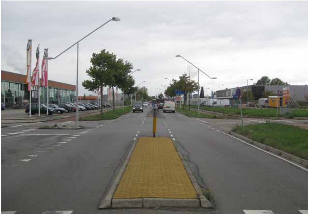
7. Klaprozenweg bij Hulstweg/Klimopweg - bestaande situatie