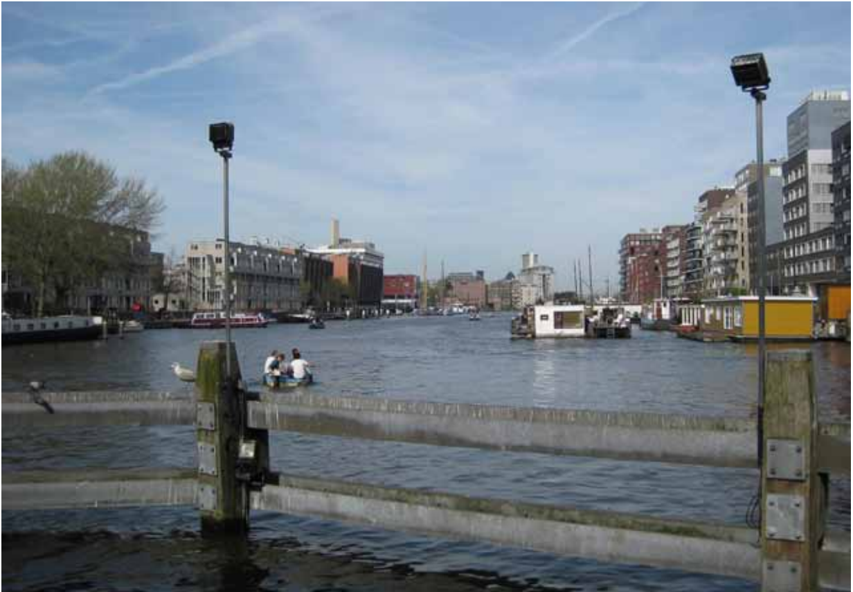
3. Westerdok - bestaande situatie