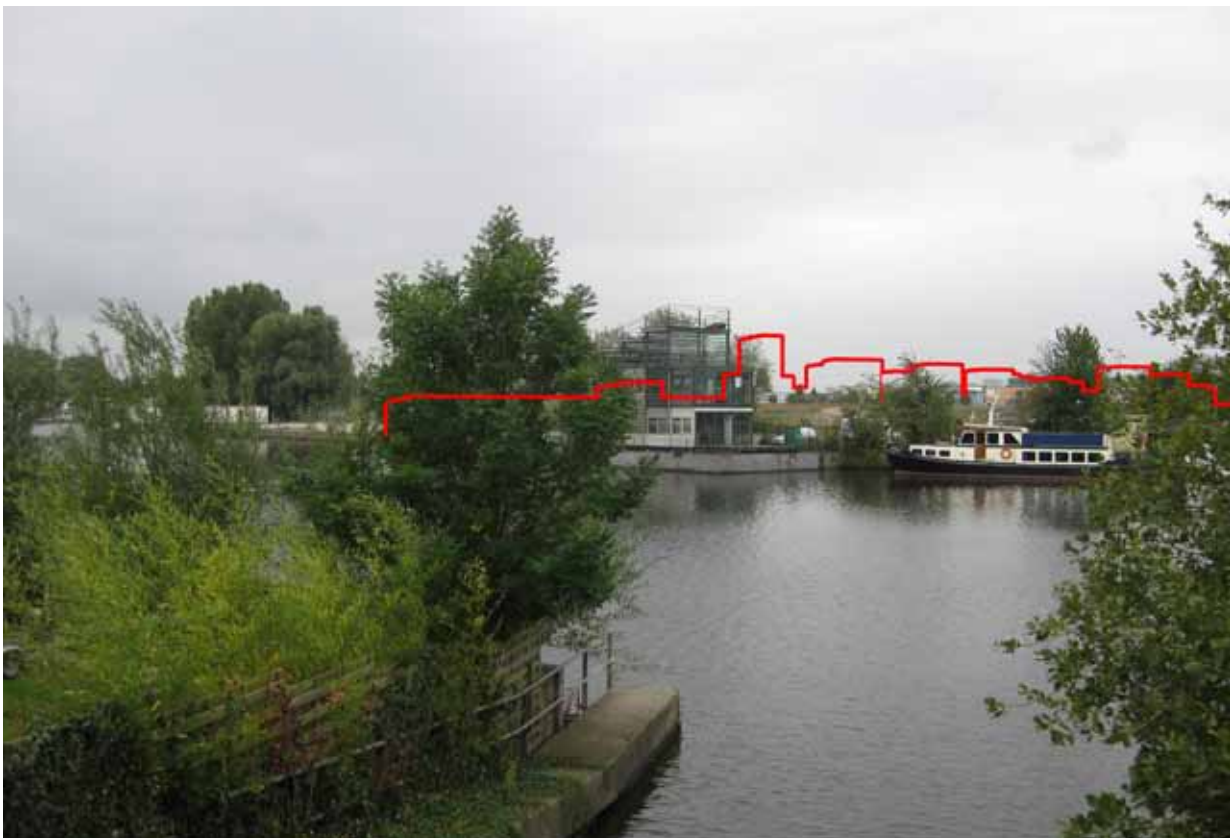
8. Buiksloterdijk aan Zijkanaal I tegenover de Bongerd - met montage ontwerp NDSM