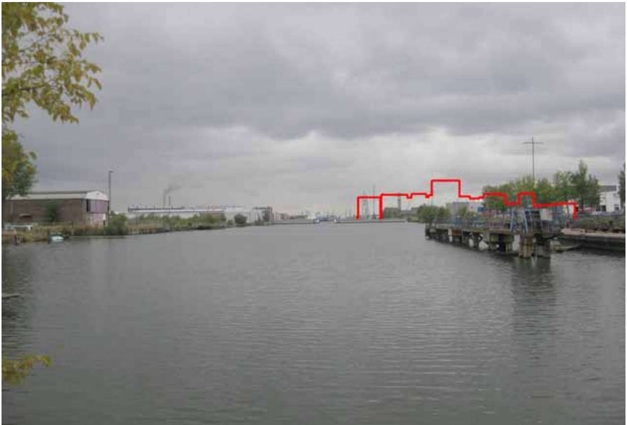
6.Kop Joh. van Hasseltkanaal-West bij Galaxy hotel - met montage ontwerp NDSM