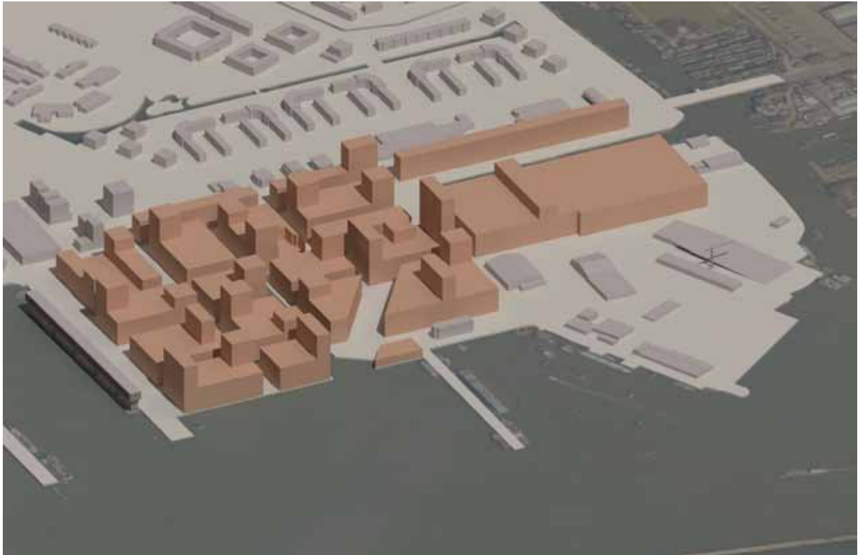
computersimulatie isometrie planvoorstel