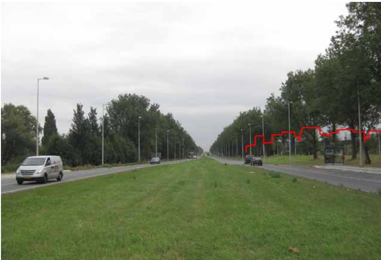
10. Klaprozenweg nabij Keerkringpark - met montage ontwerp NDSM