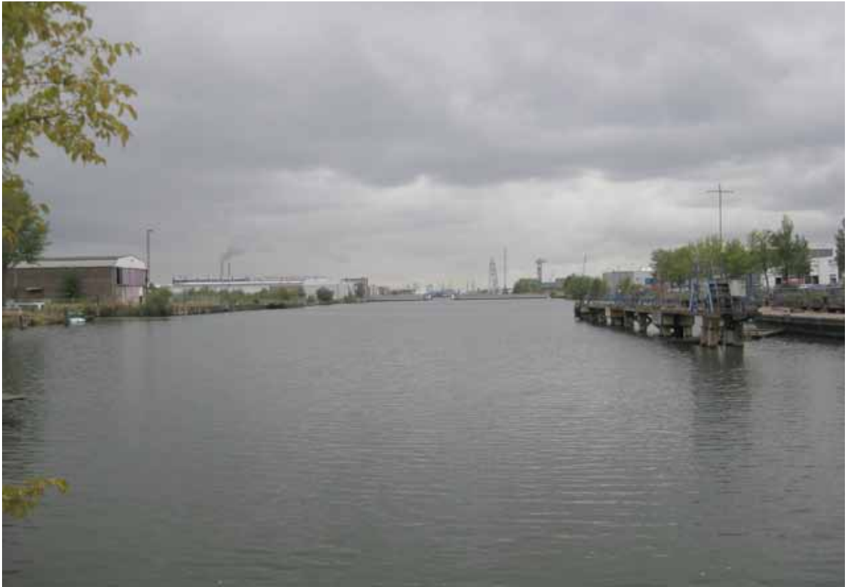
6.Kop Joh. van Hasseltkanaal-West bij Galaxy hotel - bestaande situatie