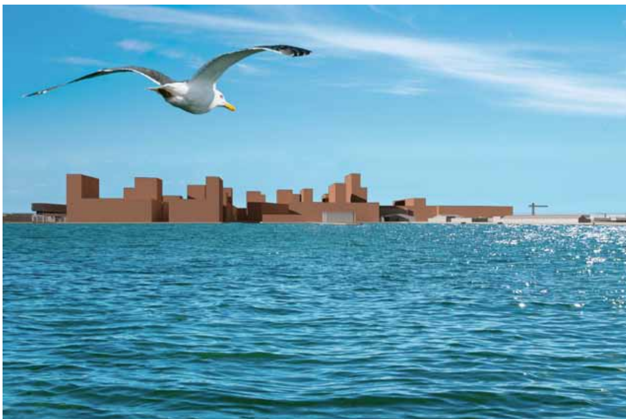
12. Stredam Houthavens/'t IJ