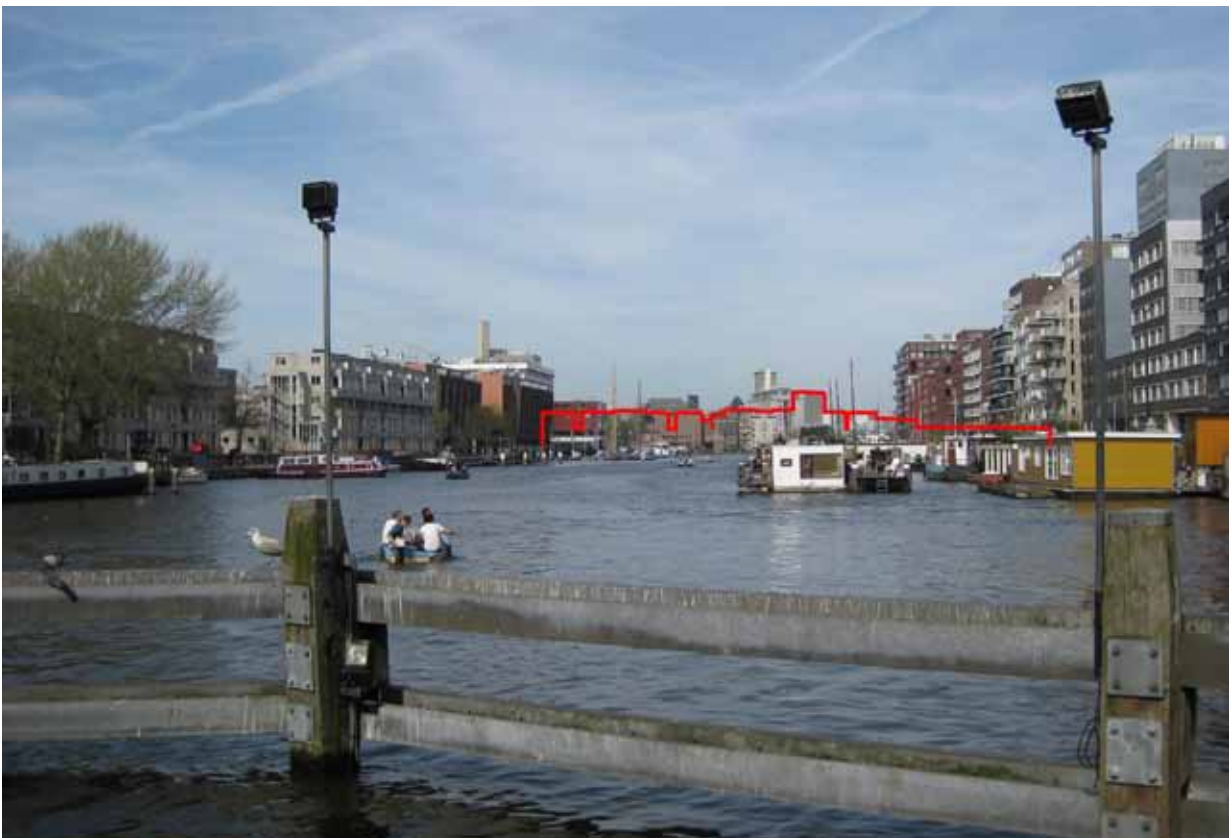
3. Westerdok - met montage ontwerp NDSM