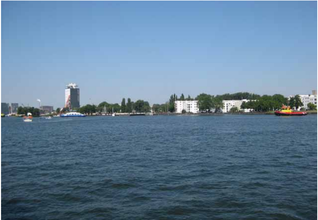
5. Kop Oostelijk Handelskade - bestaande situatie