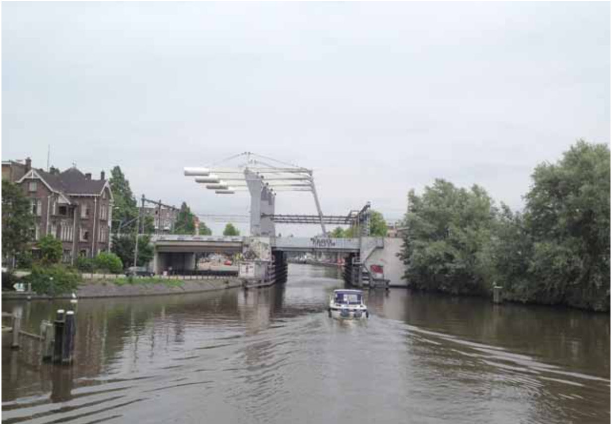
2. Singelgracht/ Nassauplein - bestaande situatie