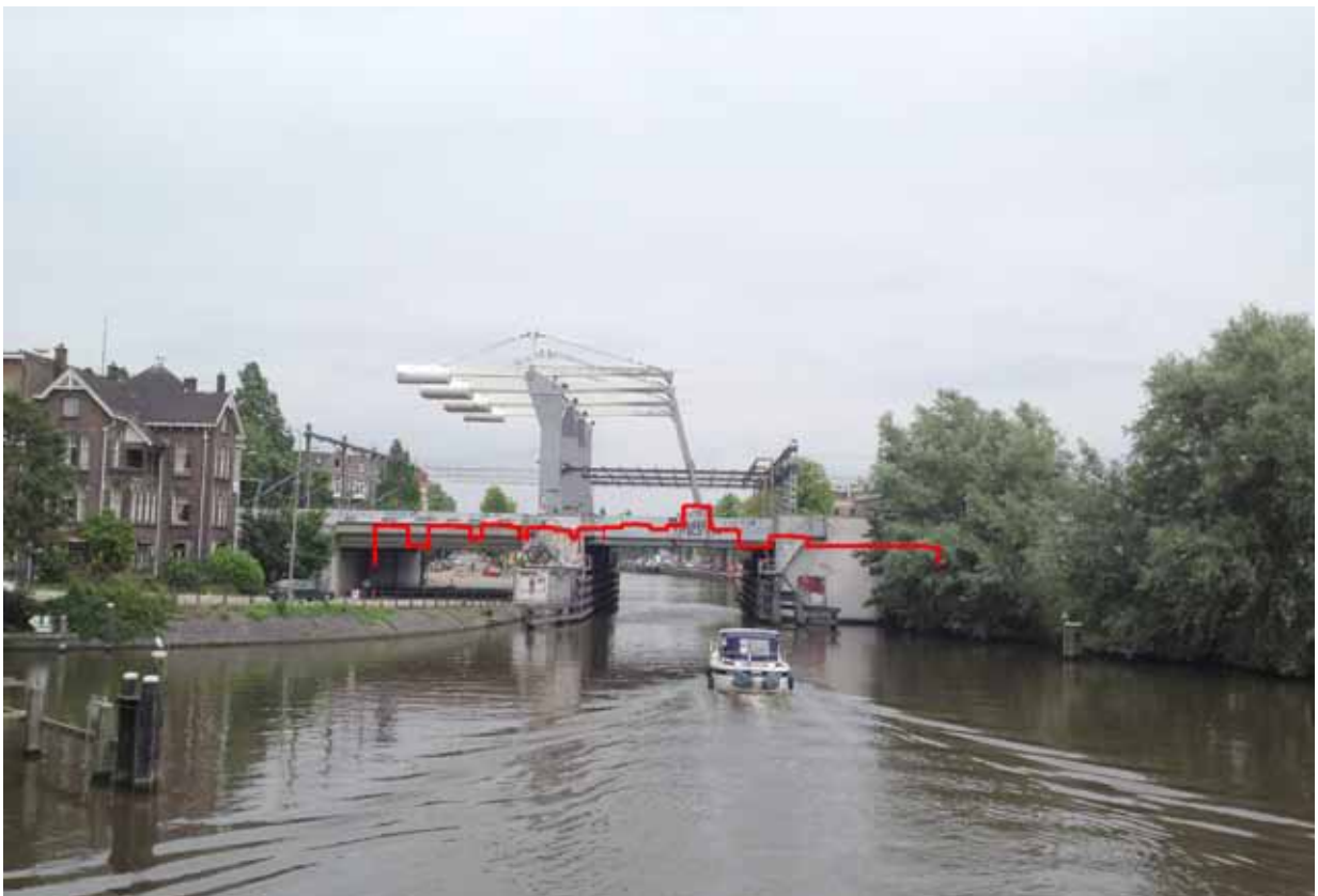
2. Singelgracht/ Nassauplein - met montage ontwerp NDSM