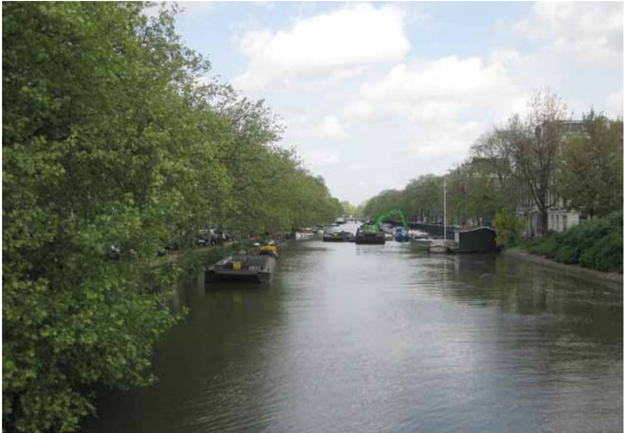
1. Singelgracht/ 2e Hugo de Grootstraat - bestaande situatie