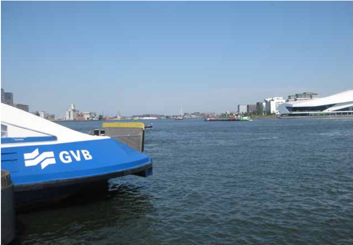
4. Pontaanlanding achter CS - bestaande situatie