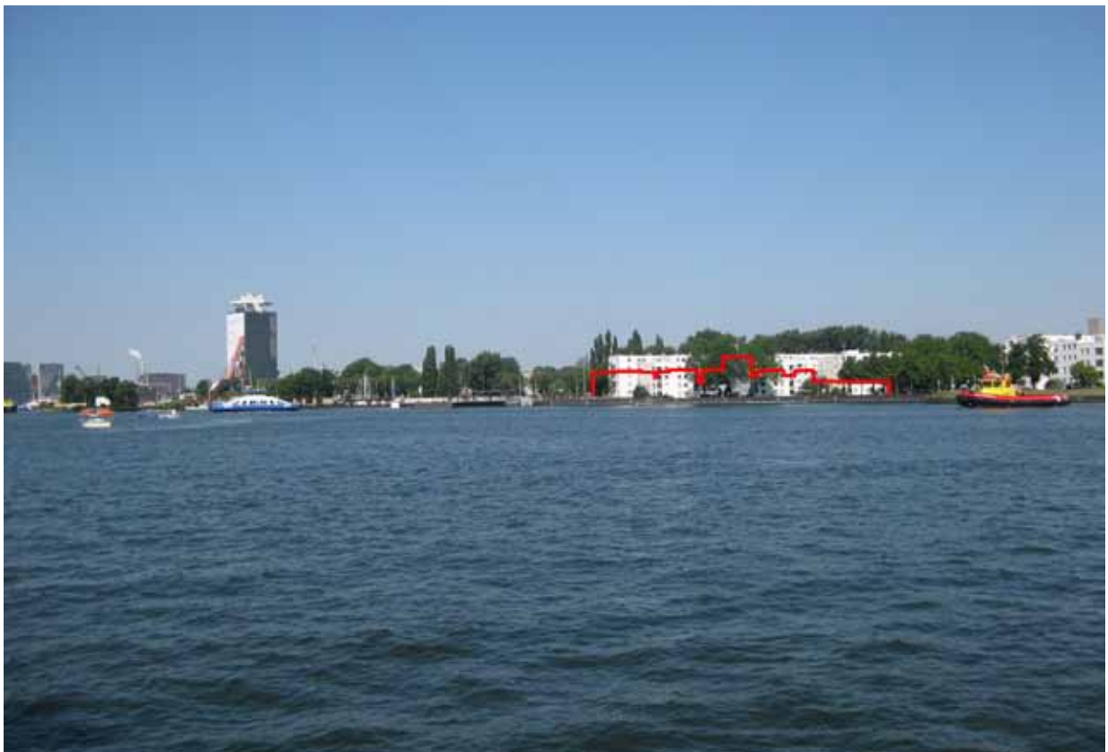
5. Kop Oostelijk Handelskade - met montage ontwerp NDSM