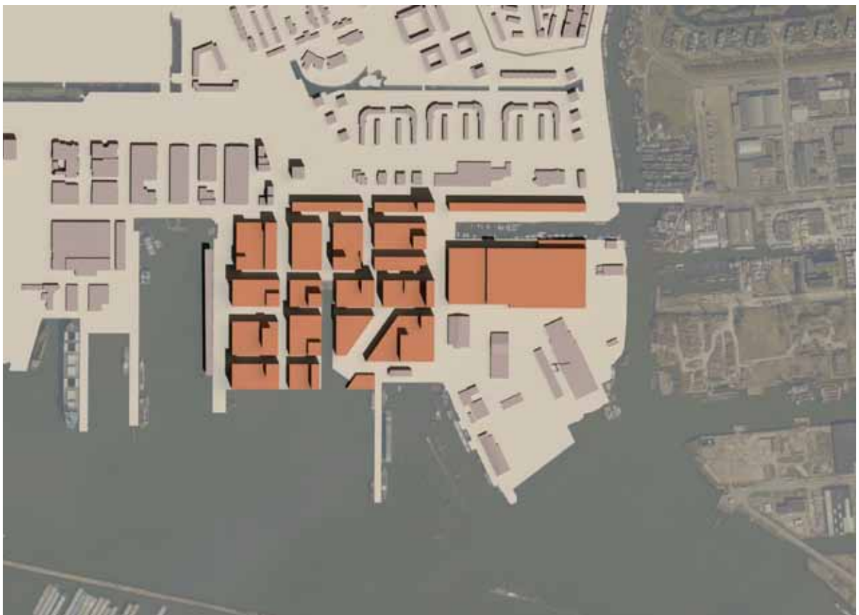
computersimulatie plattegrond planvoorstel