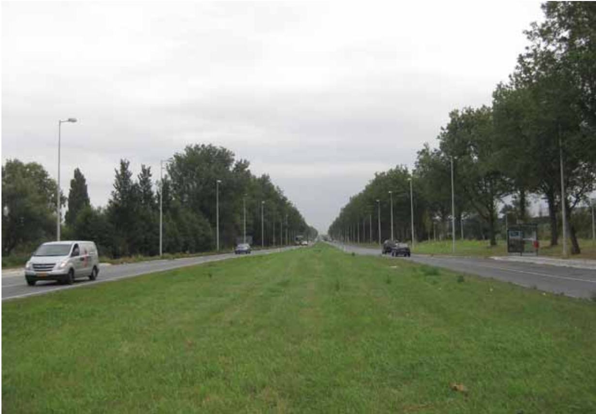
10. Klaprozenweg nabij Keerkringpark - bestaande situatie