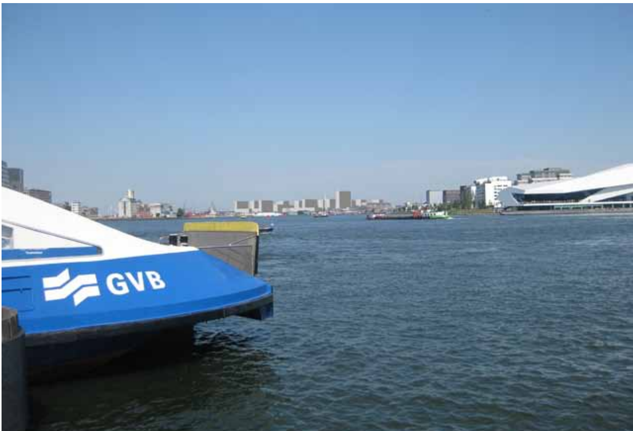
4. Pontaanlanding achter CS - met montage ontwerp NDSM