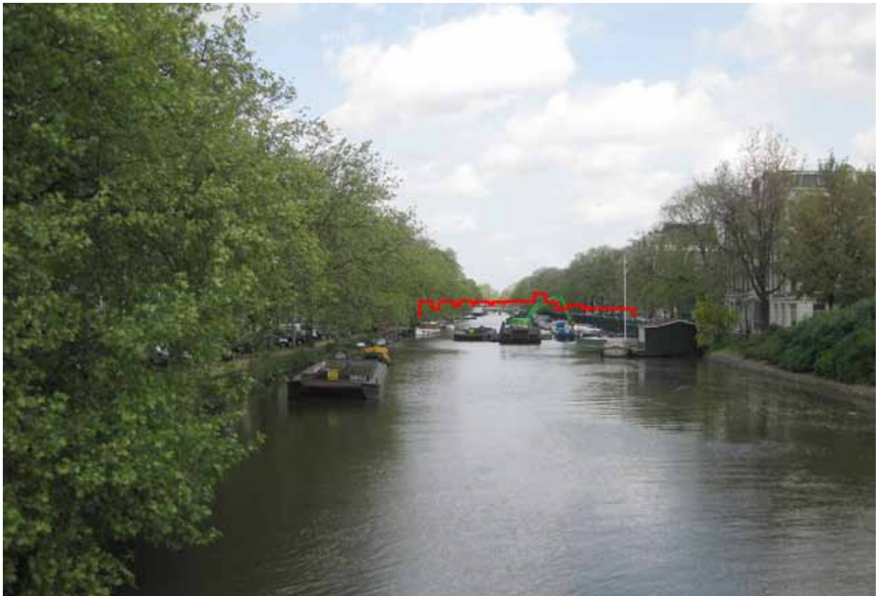
1. Singelgracht/ 2e Hugo de Grootstraat - met montage ontwerp NDSM