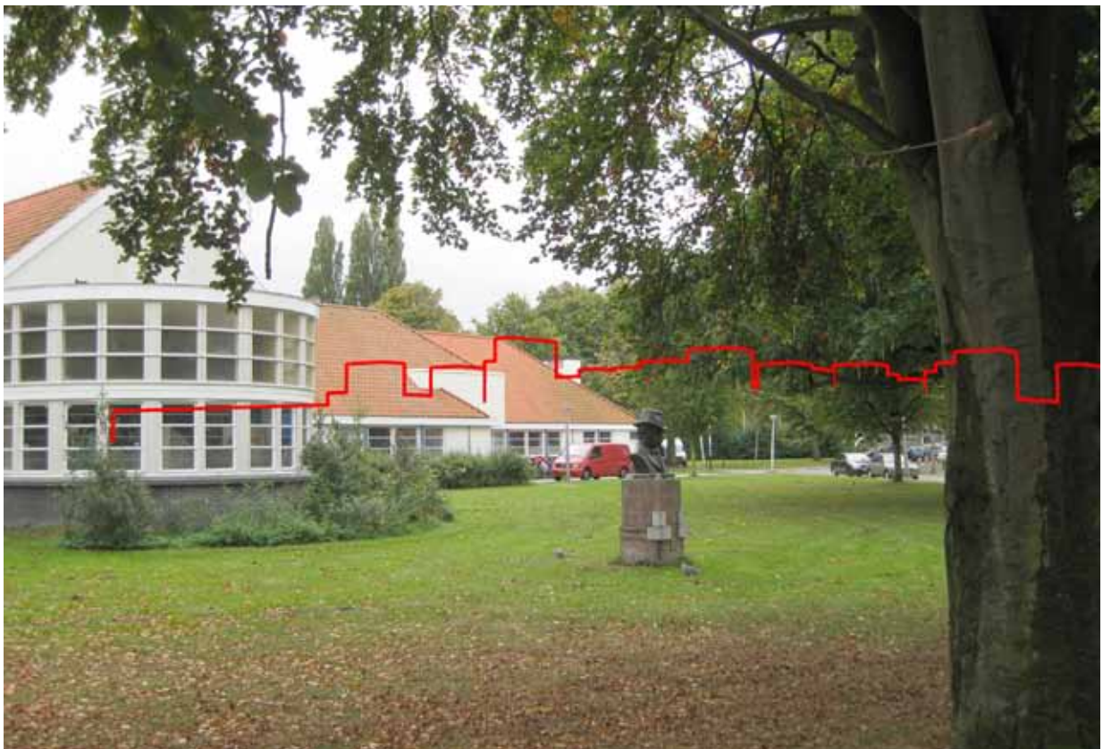
9. Aldemaranplein Tuindorp Oostzaan - met montage ontwerp NDSM