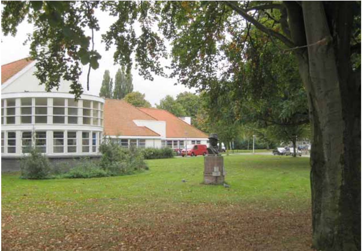
9. Aldemaranplein Tuindorp Oostzaan - bestaande situatie