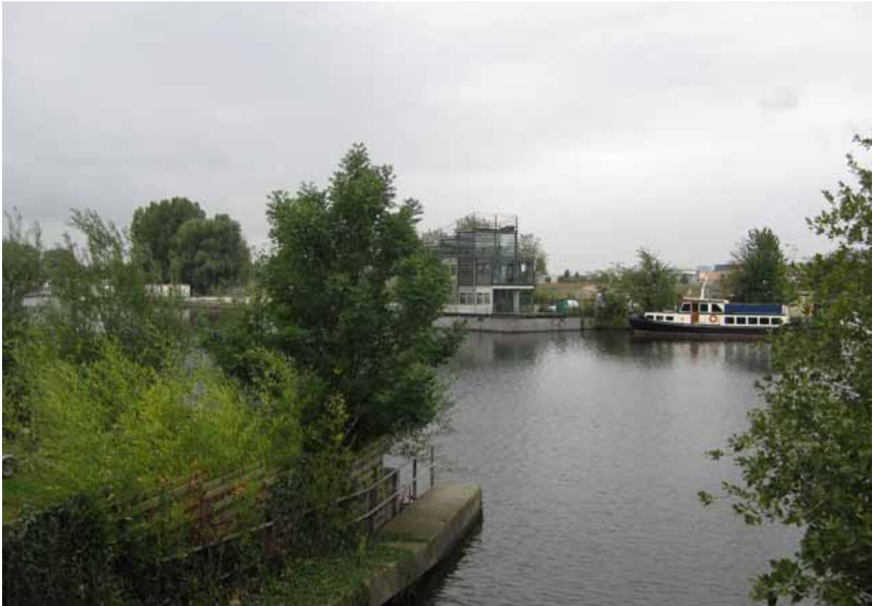
8. Buiksloterdijk aan Zijkanaal I tegenover de Bongerd - bestaande situatie