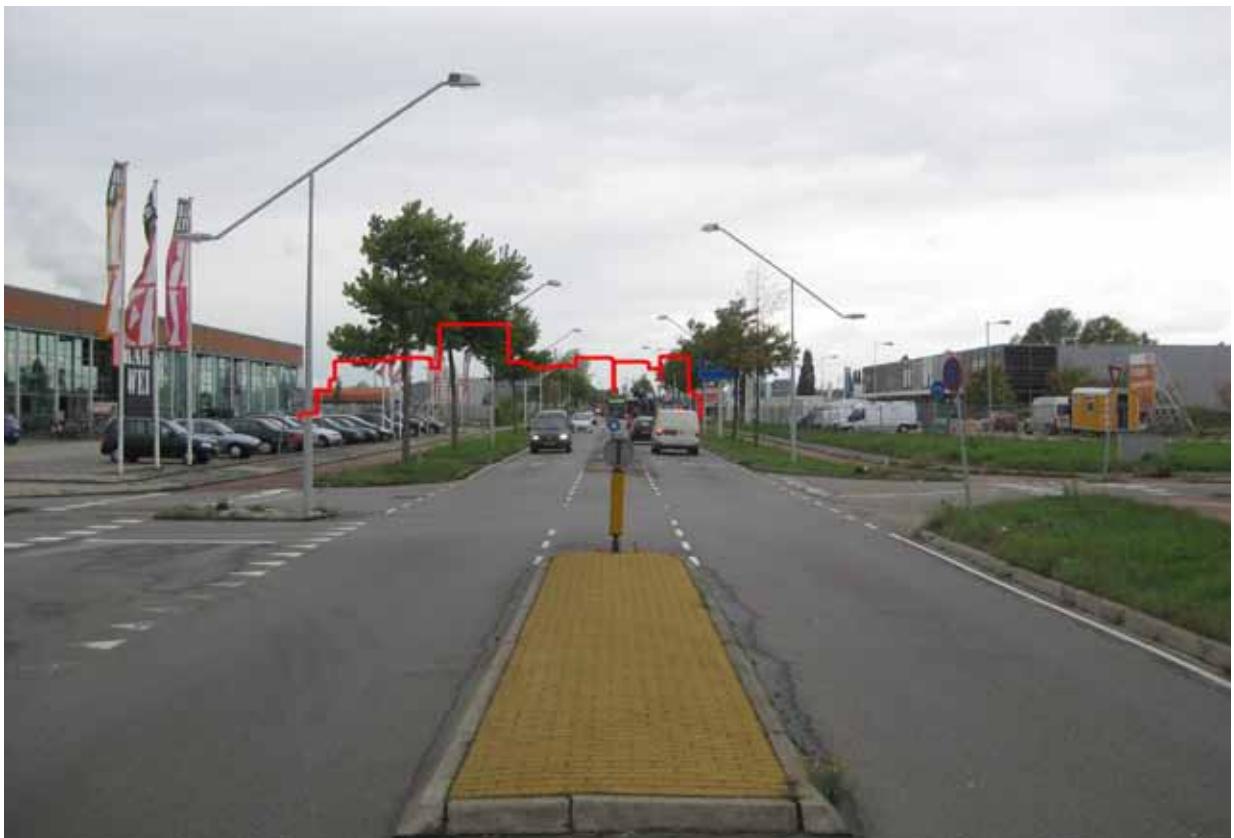
7. Klaprozenweg bij Hulstweg/Klimopweg - met montage ontwerp NDSM