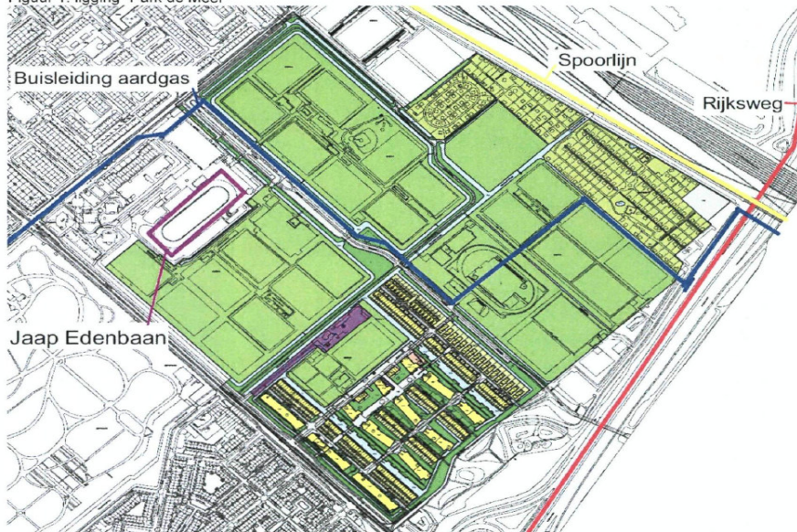
Figuur 1: ligging "Park de Meer"