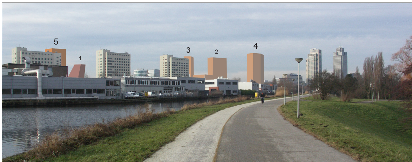
5: zicht vanaf fietspad Weespertrekvaart