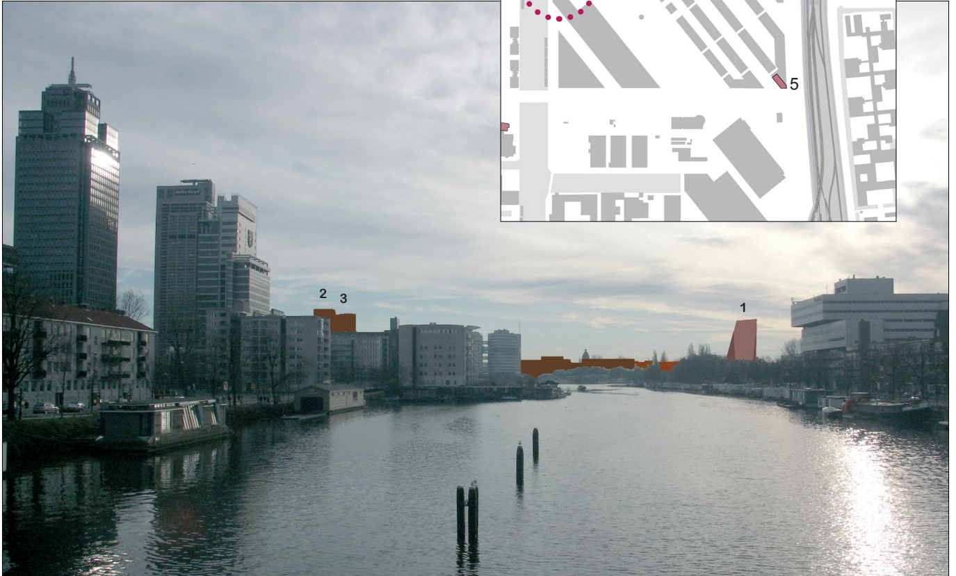
1: zicht vanaf de Berlagebrug