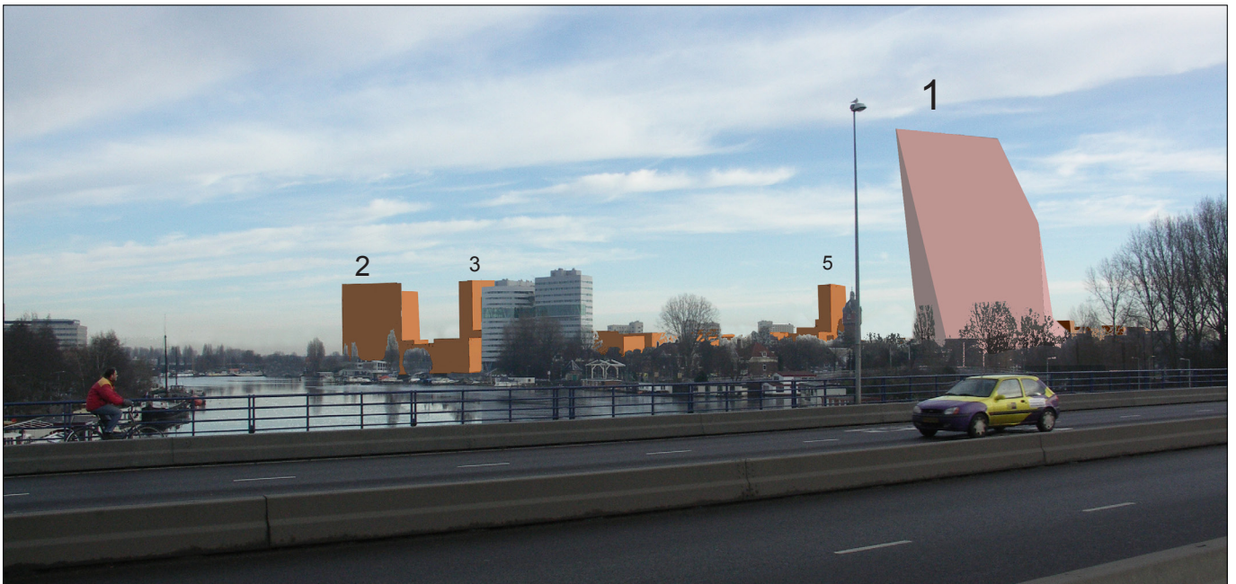
2: zicht vanaf de Utrechtsebrug