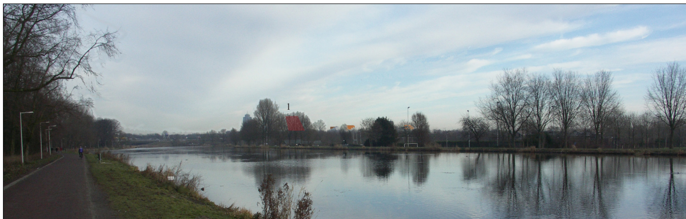
3: zicht vanaf de Amsteldijk (nauwelijks zichtbaar)