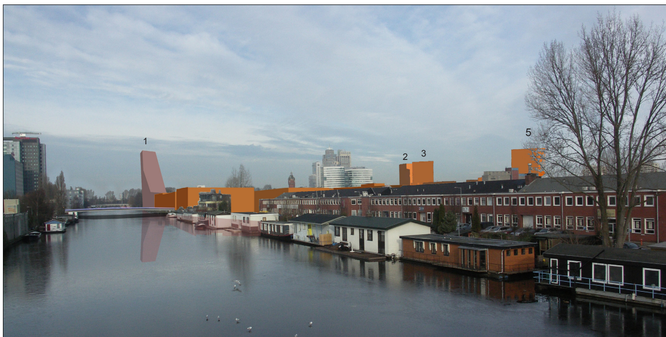
4: zicht vanaf metrostation Overamstel