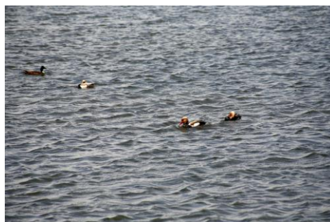
Basaltlaag en krooneenden in plangebied B