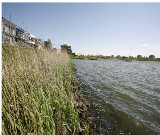
Kruidlaag en basaltblokken in geleidelijk dieper wordend water in plangebied A