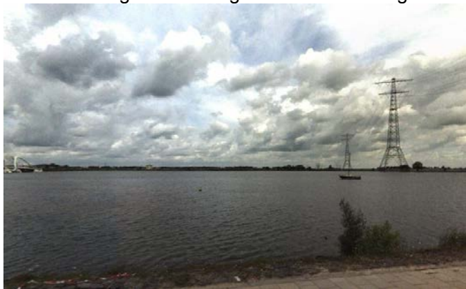
Plangebied Water-1 en Water2