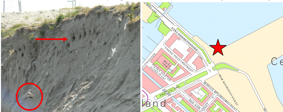
Oeverwaluwwand in gebruik ter hoogte van het surfstrand