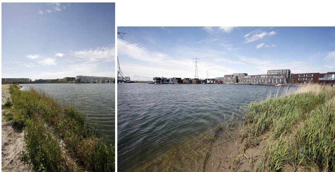
Ontbreken van basaltlaag in plangebied C