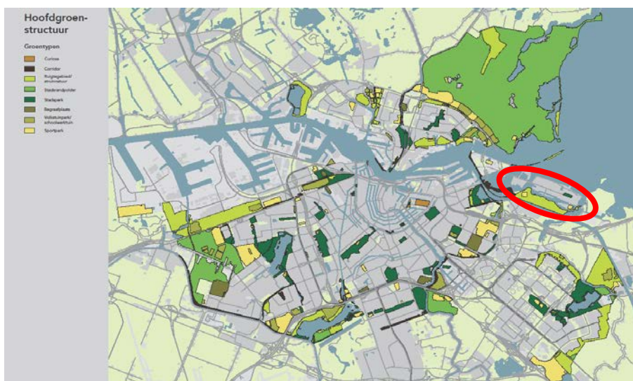
Overzichtskartaal Hoofdgroenstructuur (Structuurvisie Amsterdam)

In de structuurvisie van de gemeente Amsterdam wordt een aantal groengebieden planologisch beschermd. Functiewijzigingen zijn mogelijk en moeten aan een toetsingscommissie worden voorgelegd. Het westelijk deel van het bestemmingsplangebied bevindt zich in drie verschillende groentypen in de Hoofdgroenstructuur, namelijk; stadspark, sportpark en corridor. Bij een ruimtelijk initiatief dient een adviesaanvraag bij de Technisch Adviescommissie Hoofdgroenstructuur te worden ingediend. Het bestemmingsplan bevindt zich niet in de Hoofdgroenstructuur.