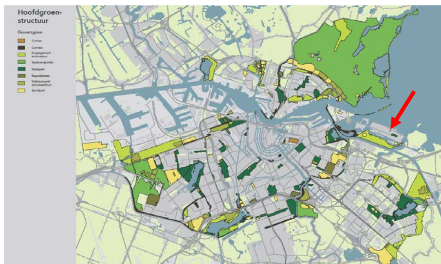
Overzichtskartaal Hoofdgroenstructuur (Structuurvisie Amsterdam)

In de structuurvisie van de gemeente Amsterdam wordt een aantal groengebieden planologisch beschermd. Functiewijzigingen zijn mogelijk en moeten aan een toetsingscommissie worden voorgelegd. Het westelijk deel van het bestemmingsplangebied bevindt zich in drie verschillende groentypen in de Hoofdgroenstructuur, namelijk; stadspark, sportpark en corridor. Bij een ruimtelijk initiatief dient een adviesaanvraag bij de Technisch Adviescommissie Hoofdgroenstructuur te worden ingediend. De bestemming bevindt zich niet in de Hoofdgroenstructuur.