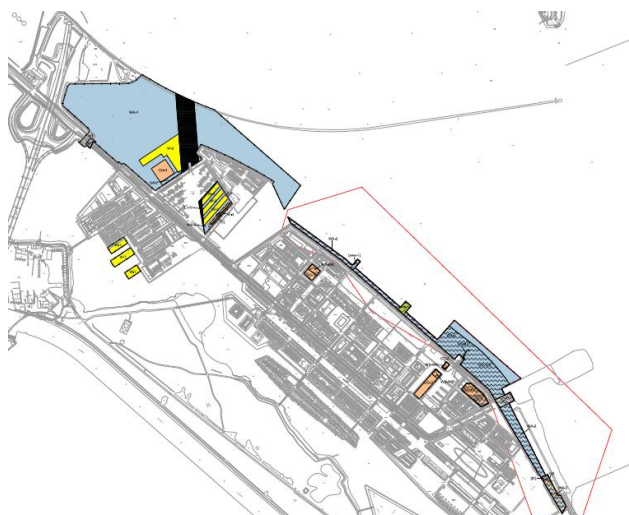
Het onderzochte bestemmingsplangebied

Zie de onderstaande afbeelding voor het onderzochte bestemmingsplangebied.