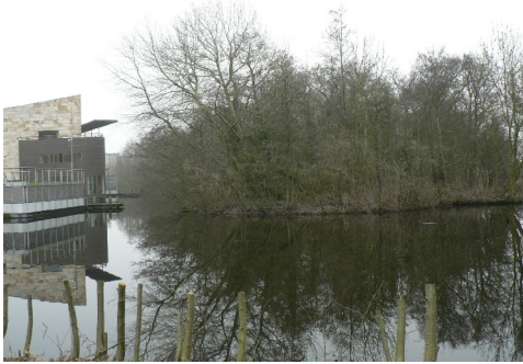
Geschikte broedlocatie voor roofvogels

In deze periode van het jaar is het niet voor alle vogelsoorten vast te stellen welke er voorkomen in het bestemmingsplangebied. Met name het westelijk deel van het bestemmingsplangebied vormt een geschikte broedlocatie voor roofvogels zoals de sperwer en buizerd (zie de onderstaande afbeelding).