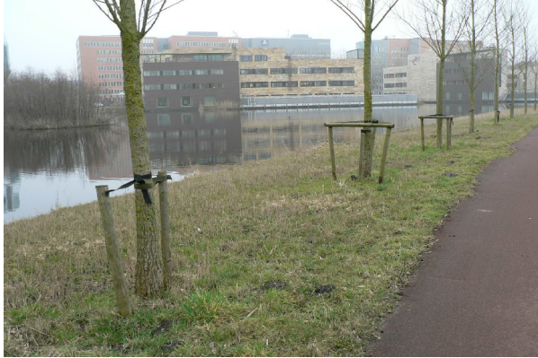
Geschikte groeilocatie voor de rietorchis, langs het Damloperspad