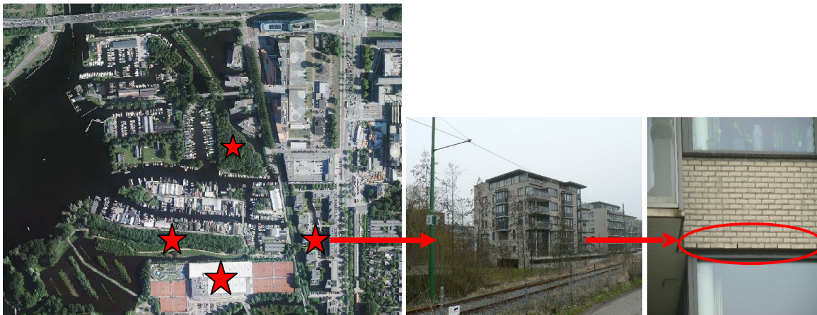
Potentieel geschikte locaties voor vleermuisverblijfplaatsen

Een deel van de bebouwing in het bestemmingsplangebied betreft een geschikte biotoop voor verschillende soorten vleermuizen zoals de gewone dwergvleermuis, de watervleermuis en de ruige dwergvleermuis. Het bebouwingstype van begin vorige eeuw en de aanwezige bomen in het plangebied betreffen namelijk een geschikt biotoop voor zomer, paar, kraam en winterverblijven. Tevens vormen de groenvakken aan de westzijde van de Jachthavenweg een geschikte foerageerlocatie voor verschillende soorten vleermuizen. Zie de onderstaande kaart voor potentieel geschikte verblijfslocaties.