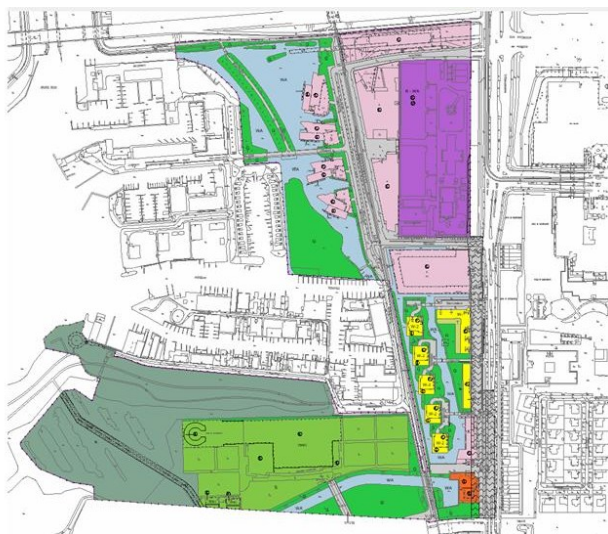
Bestemmingsplangebied Jachthavenweg e.o..

Het bestemmingsplangebied ligt in stadsdeel Zuid in de gemeente Amsterdam en wordt begrensd door de Nieuwe Meer, de Ringweg Zuid, de Amstelveenseweg en de noordzijde van de Bosbaan. Zie de onderstaande afbeelding voor het onderzochte bestemmingsplangebied.