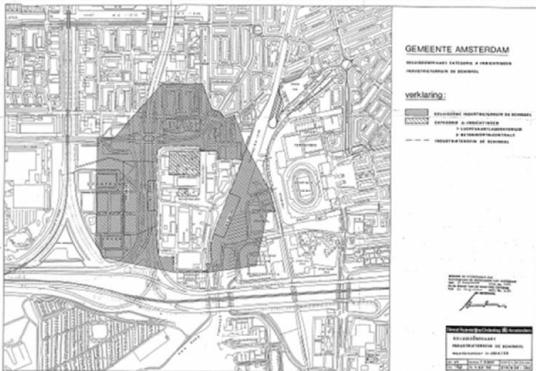
Afbeelding: Geluidszonekaart industrieterrein Schinkel (1986)

Rond bedrijventerrein Schinkel bevindt zich een geluidszone krachtens de Wgh, die op 20 augustus 1986 door de gemeenteraad van Amsterdam is vastgesteld en bij Koninklijk Besluit is goedgekeurd (zie onderstaande afbeelding). Destijds bevonden zich twee A-richtingen op het terrein, namelijk de reeds vertrokken betonmortelcentrale langs de Riekerhaven en het nog aanwezige NLR langs de Anthony Fokkerweg.