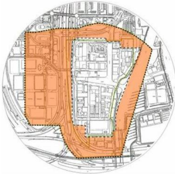
Afbeelding: geluidszone bestemmingsplan Bedrijventerrein Schinkel 1999

plaatsgevonden. De zuidelijke en westelijke begrenzing van de zone vallen buiten de grens van stadsdeel Zuid op grondgebied van stadsdeel Nieuw-West. Voor het deel van de geluidszone die binnen stadsdeel Nieuw-West valt wordt de zone in het kader van dit bestemmingsplan geactualiseerd en gewijzigd vastgesteld.