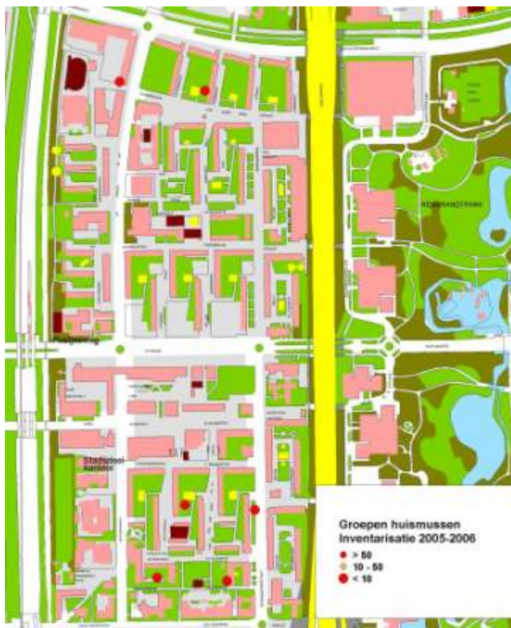
Locaties kolonies huismussen

Langs de oevers van de waterpartijen broeden watervogels als wilde eend, meerkoet en waterhoen.