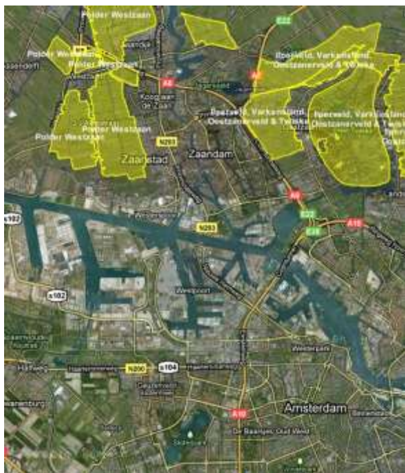
Ligging van Natura 2000-gebieden

Het plan bevindt zich buiten de Speciale Beschermingszones. Externe werking van het plan op Habitat- of Vogelrichtlijngebieden is niet aannemelijk. Het plangebied ligt niet in de Provinciale Ecologische Hoofd Structuur (PEHS) en maakt geen deel uit van de Hoofdgroenstructuur van Amsterdam.