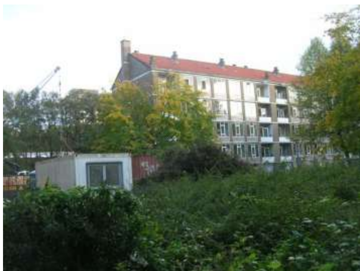
Gebouw geschikt voor vleermuizen

Voor vleermuizen is er in het plangebied goed foerageergebied: bomenrijen, de taluds van de spoorbaan en de A10 en vooral de sloot langs het talud van de spoorbaan. Ook direct buiten het plangebied zijn goede foerageergebieden: het Rembrandtpark en het Sloterpark. Flats, zoals er vele in het plangebied staan bleken in stadsdeel Geuzenveld en Slotermeer geschikt te zijn voor verblijfplaatsen van gewone dwergvleermuizen. De vleermuizen gebruiken de kopse kanten van de gebouwen. Door de combinatie van goed foerageergebied in de directe nabijheid en geschikte bebouwing is de kans groot dat er vleermuizen in de gebouwen verblijven.