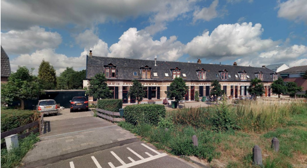
Noordelijke blok woningen met houten brug, Amsteldijk Noord 9 tm 16.

De woningen hebben geen privé voortuinen, maar liggen allen aan een gezamenlijk voorerf, dat is bedekt met grind. Daarachter, gezien vanuit de gevel, ligt de met gras begroeide, schuin aflopende oever richting de daarachter gelegen bermsloot. Slechts een smalle strook groen scheidt de bermsloot van de (geasfalteerde) Amsteldijk Noord. De woningen zijn ontsloten via twee houten loopbruggen en één centraal gelegen bredere houten brug geschikt voor auto's.