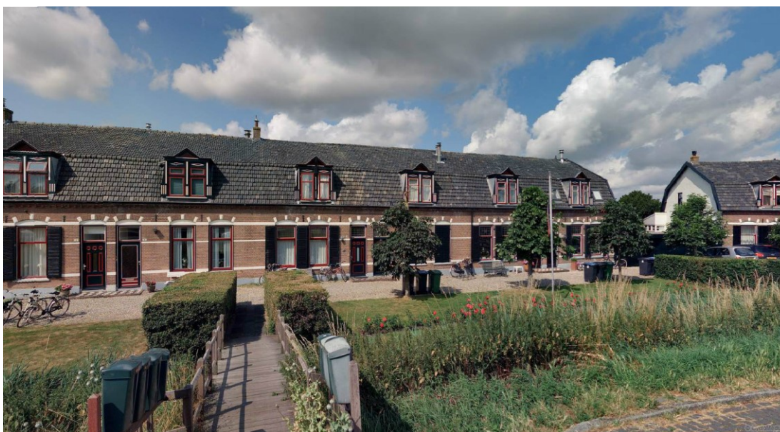
Zuidelijke blok woningen met houten loopbrug en bermsloot, 1c tm 8

adres : Amsteldijk noord 1c tm 16 postcode : 1184 TB naam object : Schneiderhuisjes, complex van 16 woningen kadastraal : W 544 tm W 551, W 553 tm W 560, W 729, W731, W 571 en W 602 (voorerf en bermsloot) bouwjaar : ca. 1910 architect : Onbekend. In opdracht van de heer C.H. Schneider.