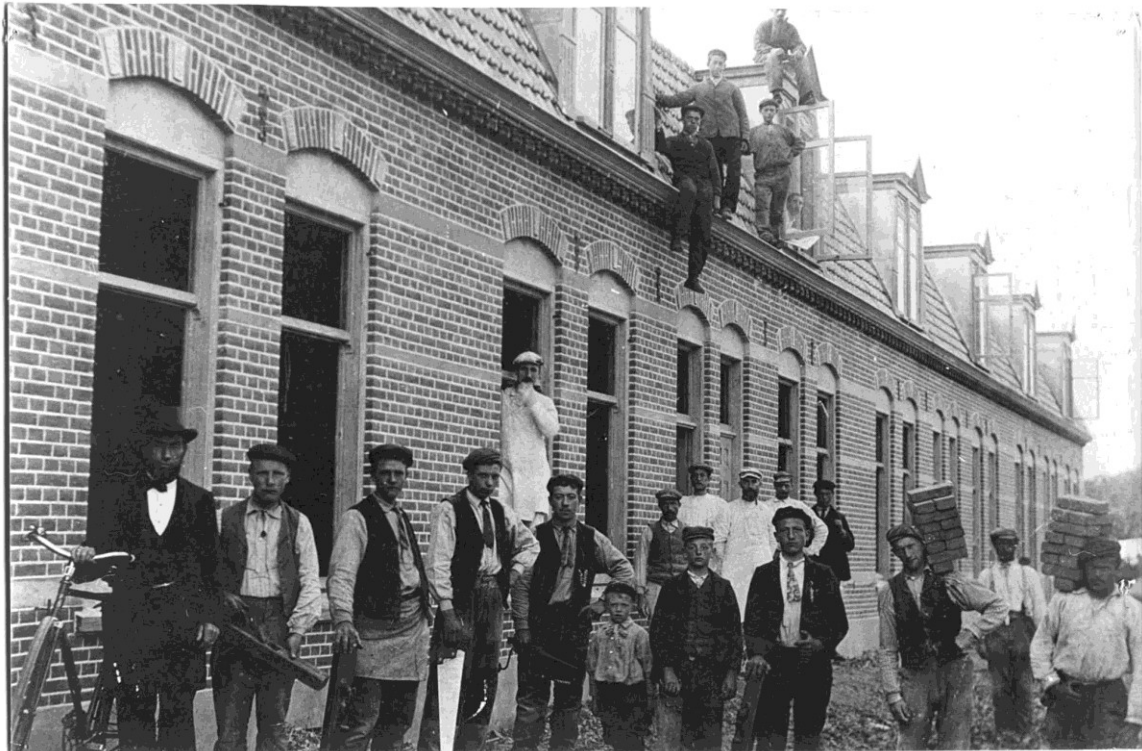
uit ca. 1910, bij de bouw van de woningen.