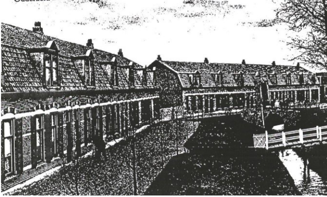
De situatie anno 1913 met de oorspronkelijke toegangsbrug van v.m. hofstede Veelust