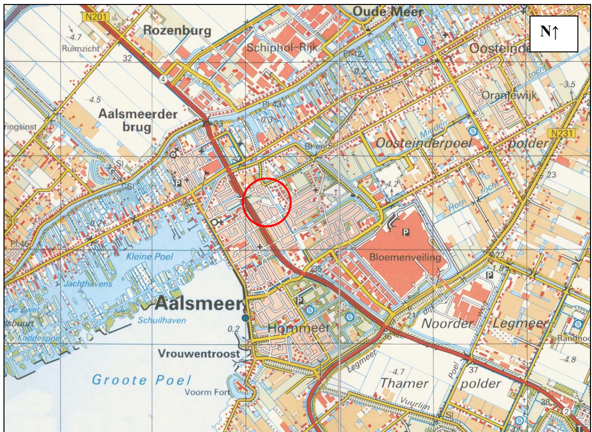
Figuur 1. Globale ligging van het plangebied.

Onderhavig bureau heeft in 2007 een onderzoek uitgevoerd naar het voorkomen en de verspreiding van beschermde planten- en diersoorten in en direct rond het toekomstige woningbouwgebied Spoorlaan te Aalsmeer 1 . Uit dit onderzoek bleek dat een effect op de beschermde kleine modderkruiper niet kon worden uitgesloten. Op grond hiervan is ontheffing Flora- en faunawet aangevraagd en verkregen voor de realisatie van het woningbouwgebied Spoorlaan. Deze ontheffing loopt eind 2012 af en de situatie kan sinds 2007 zijn veranderd. Op grond hiervan is gevraagd aan onderhavig bureau om verkennend onderzoek uit te voeren ter bepaling van de huidige situatie. In onderhavige rapportage worden daarvan de resultaten weergegeven.