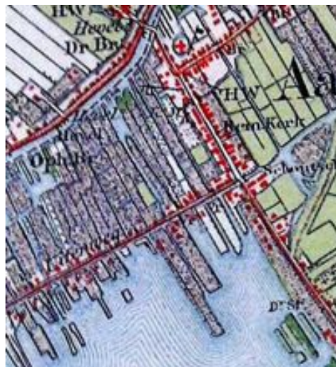
Kaart uit 1868: de Haarlemmermeer en Stoommeer zijn drooggelegd, duidelijk herkenbaar is het bebouwingslint langs de Uiterweg. Rechts: kaart van 1905 waarop de langgerekte kavels langs de Uiterweg goed zichtbaar zijn.