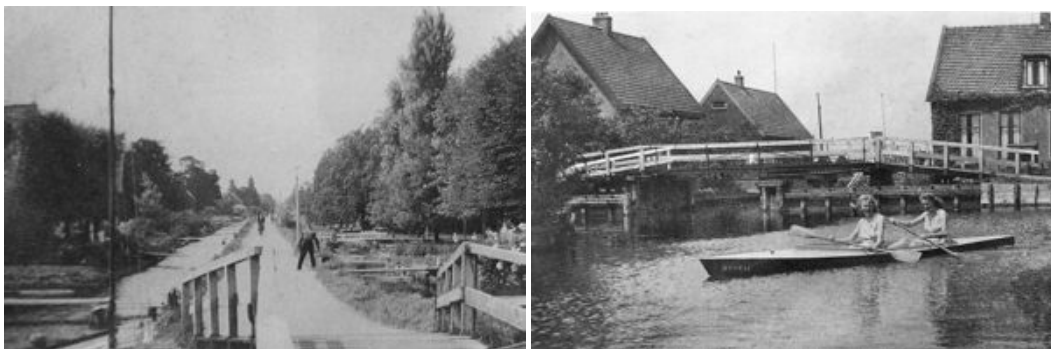
De Uiterweg van de Dirk Baardsebrug in 1948; de brug vanaf het water in 1940