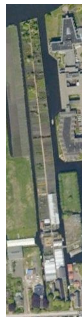
De Historische Tuin aan de Uiterweg; de kas van de Historische Tuin vanaf de Brandewijnsloot en het gehele perceel op een satellietfoto