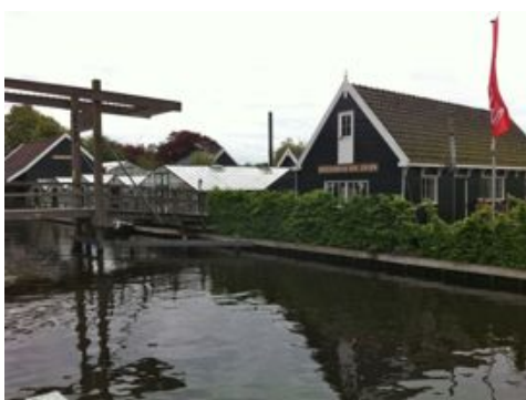
Historische Tuin vanaf het Praamplein