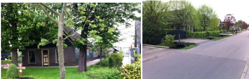
De Historische tuin vanaf de Uiterweg; de Uiterweg