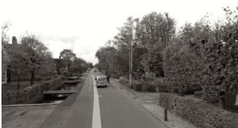
De Uiterweg c. 1920 en 2012