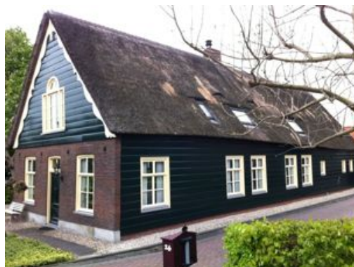
Bebouwing langs de Uiterweg: nummers 15 en 28