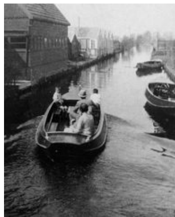
Impressie van de kwekerijen aan de Uiterweg voor de droogmaking van de Haarlemmermeer, getekend door Jan J. Bosma in 1937. Rechts: De lange Brandewijnsloot die langs de huidige Historische Tuin loopt, in 1950