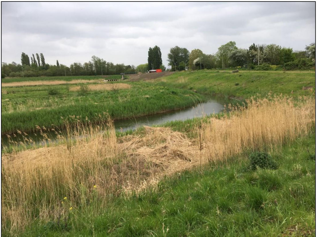
Figuur 5 De sloten zijn geschikt voor vissen, watervogels en voortplantingsbiotoop van amfibieën.