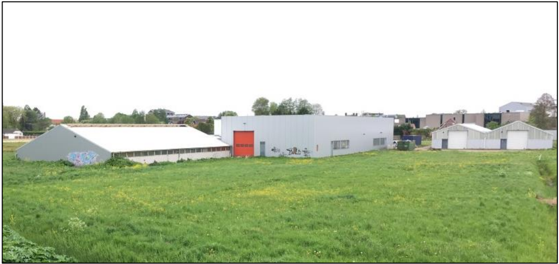
Figuur 4 In en rond de gebouwen zijn geen potentiële nestlocaties van vogels, vleermuizen of andere beschermde soorten aangetroffen.