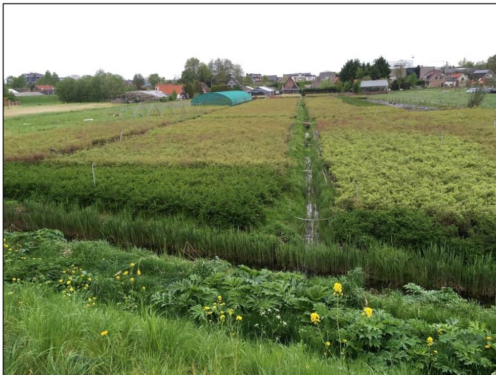
Figuur 3 Binnen het plangebied bevindt zich een kwekerij met een tijdelijke kas.