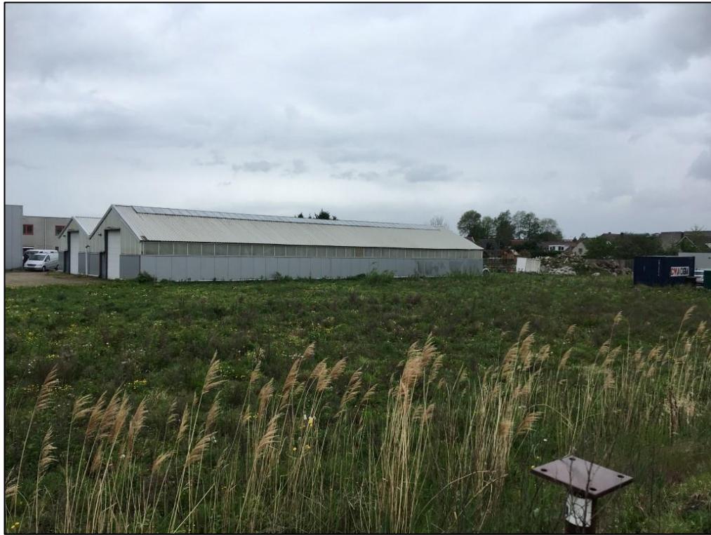
Figuur 6 De gebouwen zijn ongeschikt voor vogels, zoogdieren en andere soorten. De berg puin/steen aan de voorzijde van de loods is geschikt voor zoogdieren en amfibieën