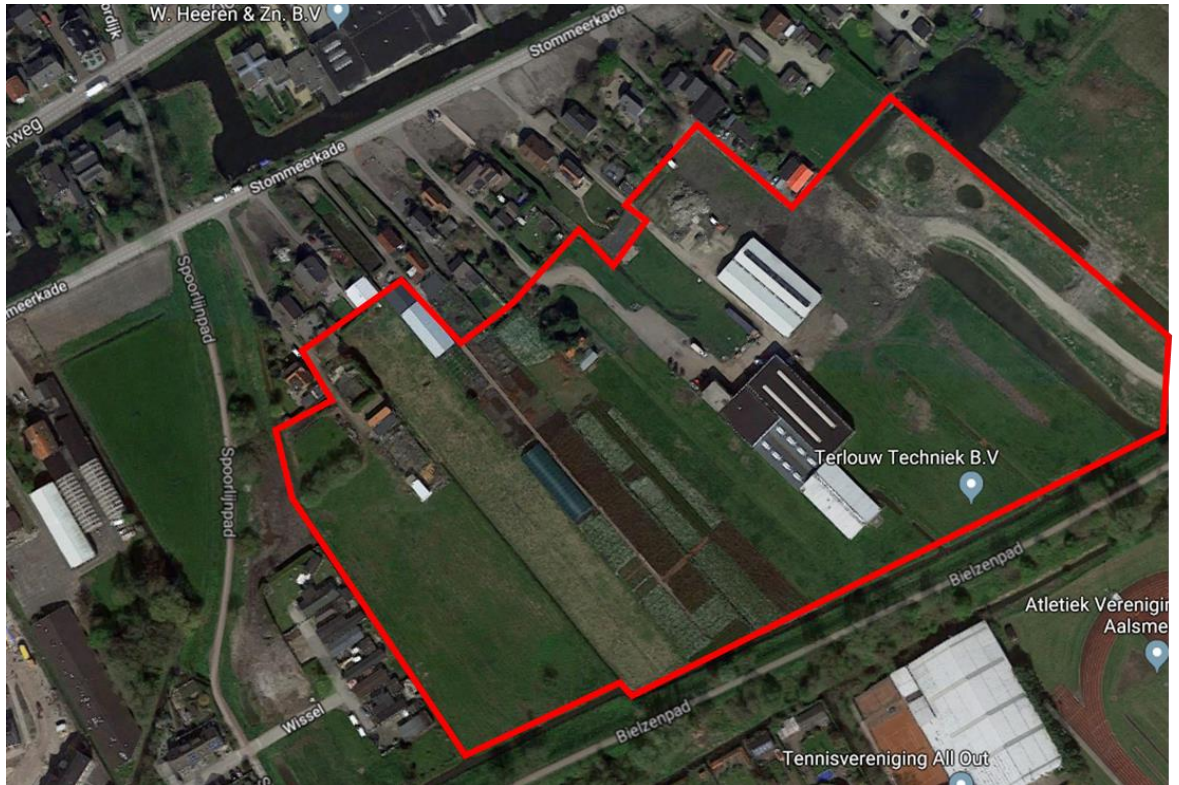
Figuur 1 locatie werkterrein

Meervastgoed is voornemens om bestaande gebouwen te slopen en op deze locatie woningen te bouwen. De werklocatie ligt aan de Stommeerkade in Aalsmeer.