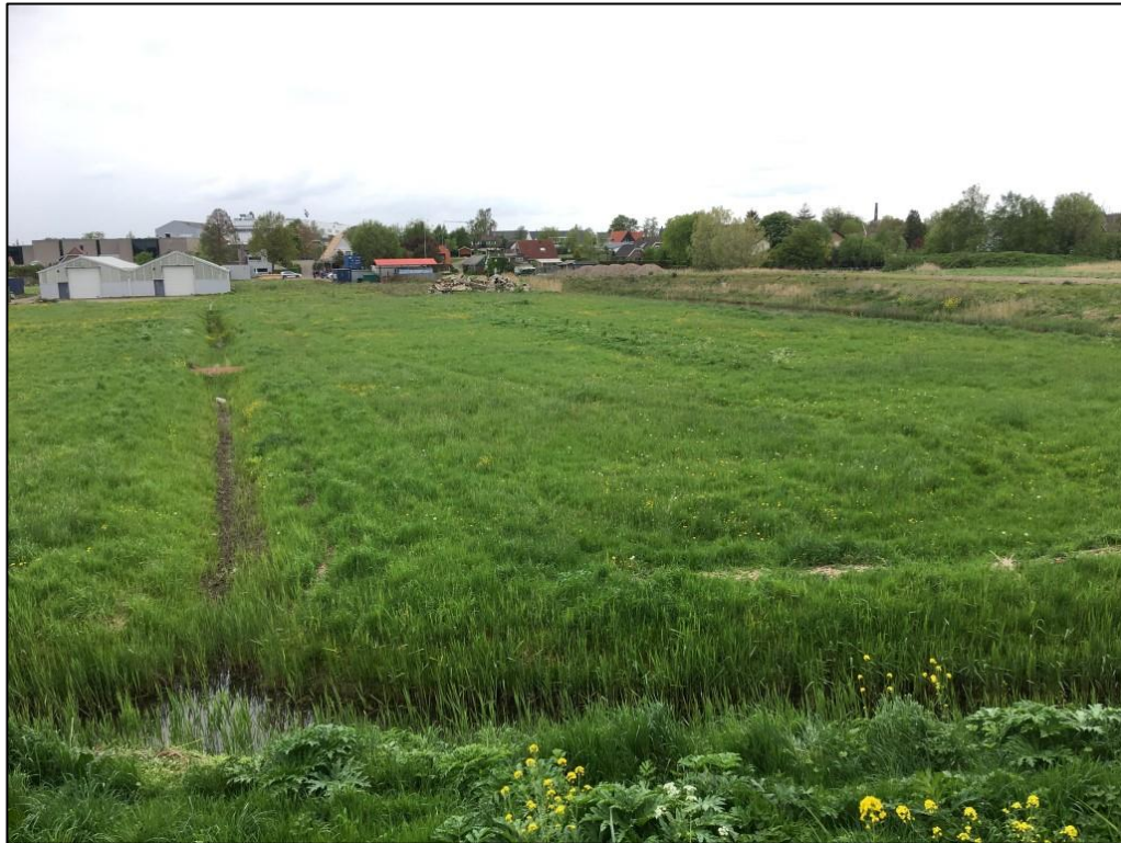
Figuur 2 Het plangebied bestaat uit percelen met gras. Langs het plangebied ligt een sloot en tussen enkele percelen liggen greppels