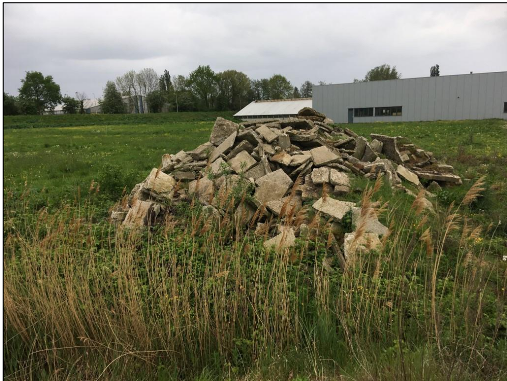
Figuur 6 De berg puin/steen aan de westkant van het plangebied is geschikt voor zoogdieren en amfibieën