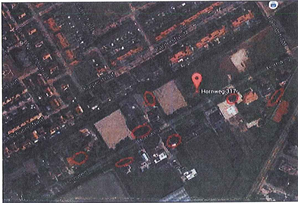
Figuur 3 - Alternatieven voor de huismus