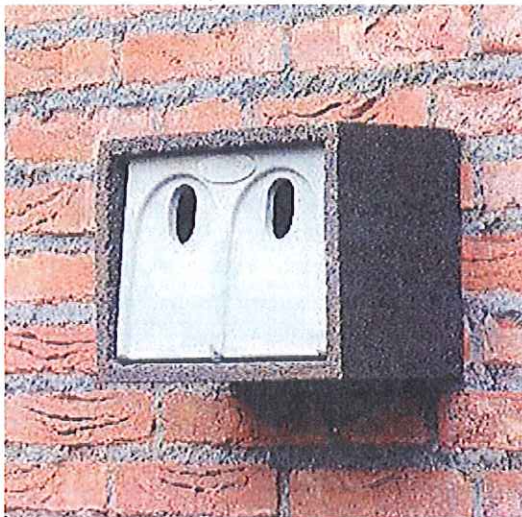
Figuur 2 - Foto dubbele kast