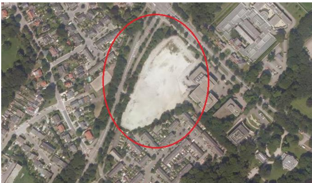
Figuur 1.1: Ligging plangebied (rood omcirkeld).

Voor de locatie Het Warande in Zeist bestaan herontwikkelingsplannen. Het voormalige BVG-terrein op de hoek van de Utrechtseweg en de Kromme Rijnlaan ligt al sinds enige jaren braak. In opdracht van Aveco de Bondt is voor de herontwikkeling van het terrein een verkennend natuuronderzoek uitgevoerd om de effecten van de voorgenomen ontwikkeling op beschermde natuurwaarden in beeld te brengen. Voorliggend rapport bevat de uitkomsten van het verkennend natuuronderzoek.